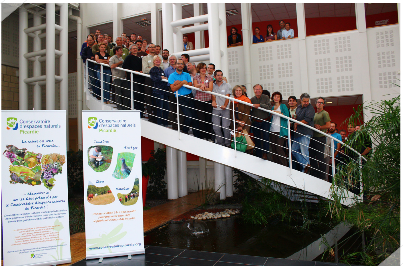
M. AGNES/Institut LaSalle