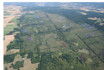
B. Couvreur / CEN Picardie

La question du renforcement se pose également pour d'autres espèces méconnues qui pourraient également bénéficier de programmes spécifiques au vu de leur intérêt national à européen ( Dolomedes plantarius ).