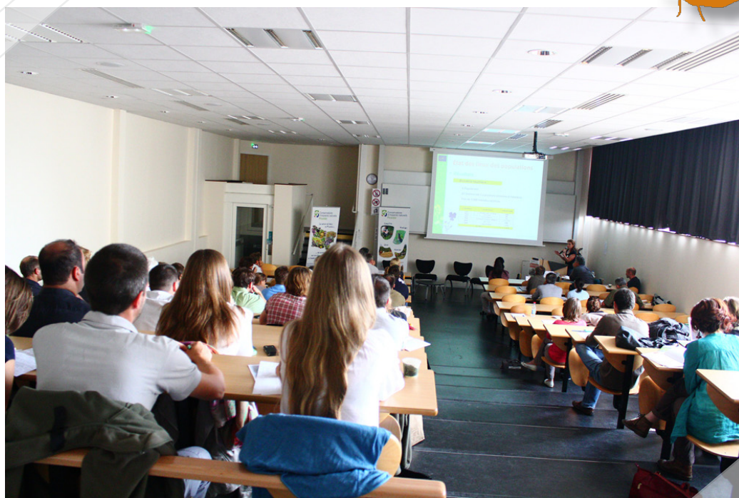
M. AGNES/Institut LaSalle