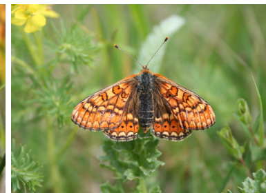
D. Top / CEN Picardie, K Georgin