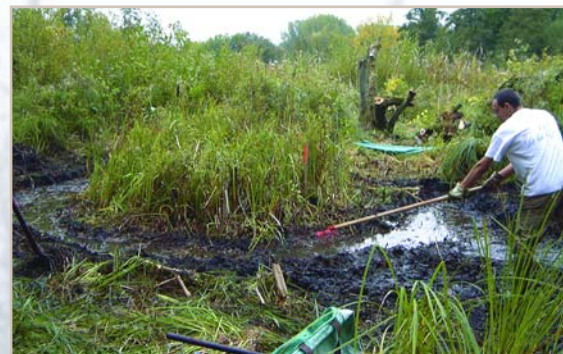
Chantier nature et étrépage à la réserve naturelle des Marais d'Isle, à Saint-Quentin