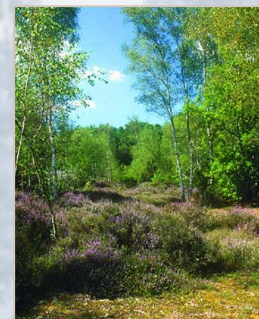
Landes de Royaucourt et Chailvet

Durée : 2h30 le matin, 3 heures l'après-midi. Prévoir un pique-nique.