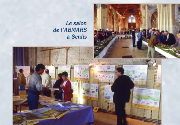
Le salon de l'ABMARS à Senlis

L'Association des Botanistes et Mycologues Amateurs de la Région de Senlis (ABMARS) accueille le Conservatoire dans le cadre de son salon annuel à Senlis. Cette manifestation conviviale s'adresse à tous les publics, petits et grands, passionnés ou curieux ! Venez nous rendre une petite visite ! Vous êtes adhérent et vous souhaitez vous investir dans la préparation ou la tenue de ce stand ? N'hésitez pas à nous contacter au 03 22 89 63 96 ou par mail (e.fery@conservatoirepicardie.org) : votre participation sera appréciée ! Salon ouvert le samedi après-midi et le dimanche toute la journée Entrée gratuite • Ancienne église Saint-Pierre