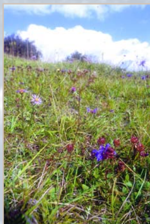
Pelouses calcaires fleuries, à Chevreigny