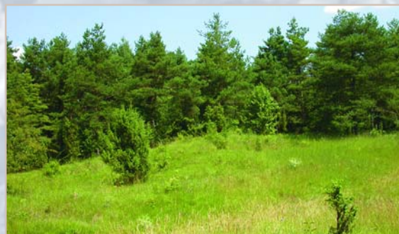
Pelouses calcicoles à Chermizy-Ailles