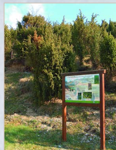
La Montagne des Grès à Grattepanche