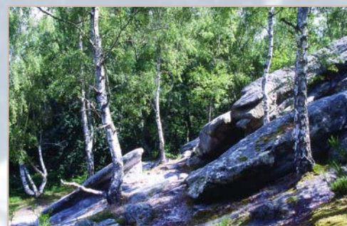
La Pierre-Glissoire, à Péroy-les-Gombries

Pour les personnes restant sur la journée, nous vous proposons de partager un pique-nique collectif constitué de toutes les spécialités que chacun choisira de faire découvrir aux autres bénévoles.