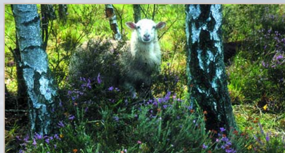
Pâturage par les moutons, à Versigny