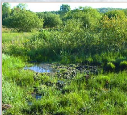
Prairie humide à Mauregny-en-Haye