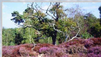
Landes de Plailly

Renseignements : http://www.cr-picardie.fr/