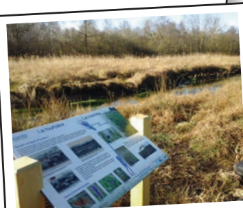
Des panneaux d'information jalonnent le sentier