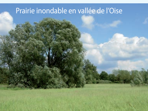
Prairie inondable en vallée de l'Oise