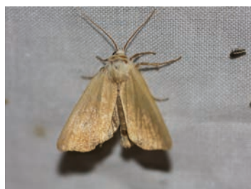
Noctuelle des roselières