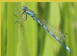
L'Agrion de mercure est une demoiselle

Comment les distinguer ? C'est simple ! Lorsqu'elle se pose la libellule (Anisoptère) garde les ailes largement étendues sur les côtés. En revanche, la demoiselle (Zygoptère) replie ses ailes le long de « son dos ».