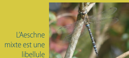
L'Aeschne mixte est une libellule

Contacts : Oise : Emmanuel Das Gracas 03 44 45 76 55 e.dasgracas@conservatoirepicardie.org