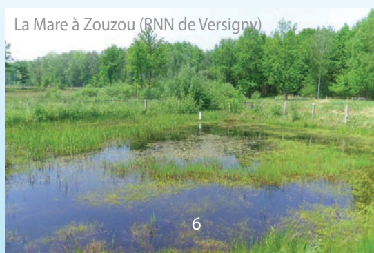
La Mare à Zouzou (BNN de Versigny)