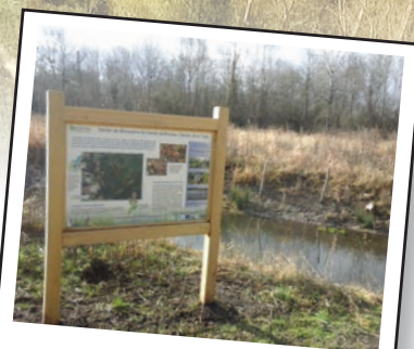
Un panneau d'accueil

Après la place de l'Eglise, prendre à droite rue du curé, puis en face rue de la Trye jusqu'à l'entrée du marais. Prenez à droite dans l'allée François Lenzi. Le sentier démarre à gauche après le pont.