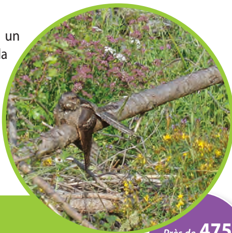
L'Engoulevent d'Europe, roi du camouflage

L'Engoulevent d'Europe est un migrateur qui arrive chez nous à la belle saison pour se reproduire. Le dernier contact de l'oiseau à Versigny datait de 2014 sur le secteur de la ferme neuve. Les écoutes et observations de cet oiseau dans le département de l'Aisne se font rares.