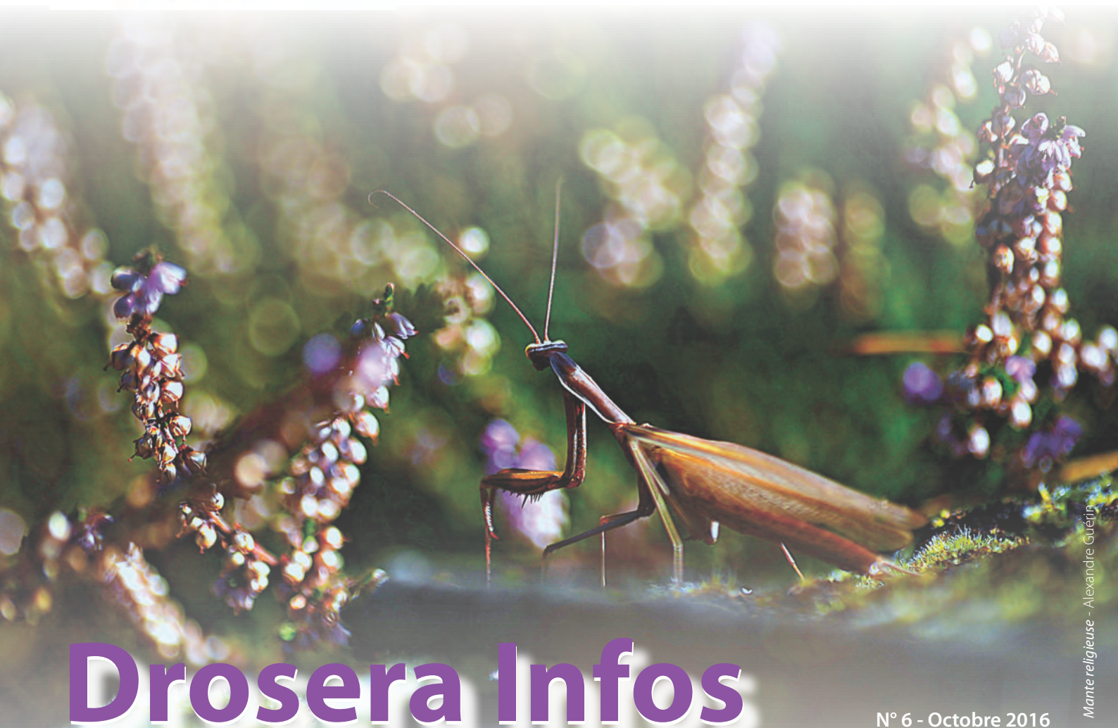
Mante religieuse - Alexandre Guérin