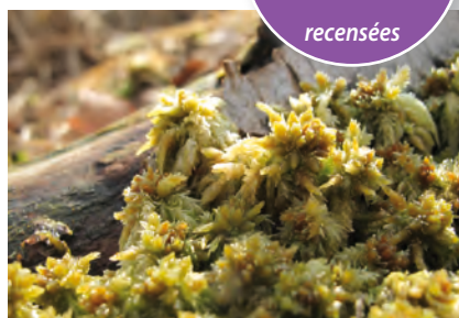
La Sphaigne des marais

Plus de 150 espèces végétales et animales d'intérêt patrimonial relevées !