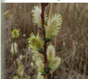
Le Saule rampant