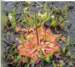
La Rossolis à feuilles rondes