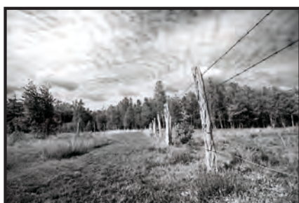
Valentine Dupont, catégorie « Paysage, activités humaines »