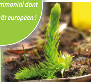
Le Lycopode des sols inondés