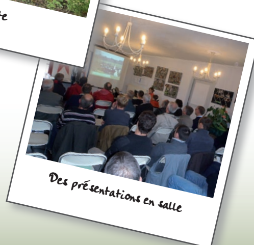
Des présentations en salle