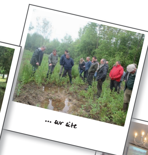
... sur site