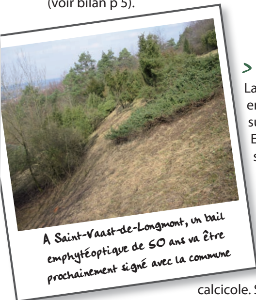
A Saint-Vaast-de-Longmont, un bail emphytéotique de 50 ans va être prochainement signé avec la commune

Protégé avec la commune depuis 1994, le coteau du Châtel se restaure progressivement. Les travaux d'abattage et de débroussaillage puis d'entretien par fauche et pâturage menés depuis 2008 ont conduit à une extension lente mais continue de la pelouse à Brachypode.