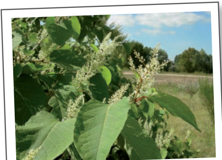
La Renouée du Japon

Les espèces invasives sont une des principales causes de la disparition de la biodiversité dans le monde. Provenant d'un autre pays ou d'une autre région, formant des peuplements denses monospécifiques et n'ayant pas de prédateur naturel chez nous, elles se développent rapidement et occupent les niches écologiques des espèces locales. Les espèces végétales sont malheureusement souvent vendues en jardinerie comme fleurs ornementales. Sur le territoire, les espèces présentes les plus répandues sont la Renouée du Japon et les Asters américains pour la flore. Pour la faune, le ragondin et le rat musqué font des dégâts considérables dans les zones humides, notamment en creusant des galeries