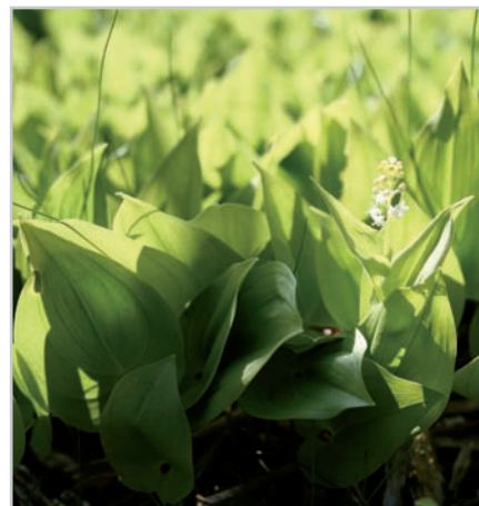
Le Maïanthème à deux feuilles

Des premiers travaux de restauration de la lande sèche et des pelouses sableuses par abattage ont été entrepris. Plusieurs interventions complémentaires de bénévoles ont permis des opérations ponctuelles précises et importantes, comme l'arrachage de semis de bouleaux. Depuis 2014, le site est équipé de panonceaux d'information sur le patrimoine naturel. En 2013, l'Engoulevent d'Europe y a été entendu pour la première fois ! Et en 2015 a été découvert le Maïanthème à deux feuilles, un cousin du muguet typique des chênaies acidiphiles.