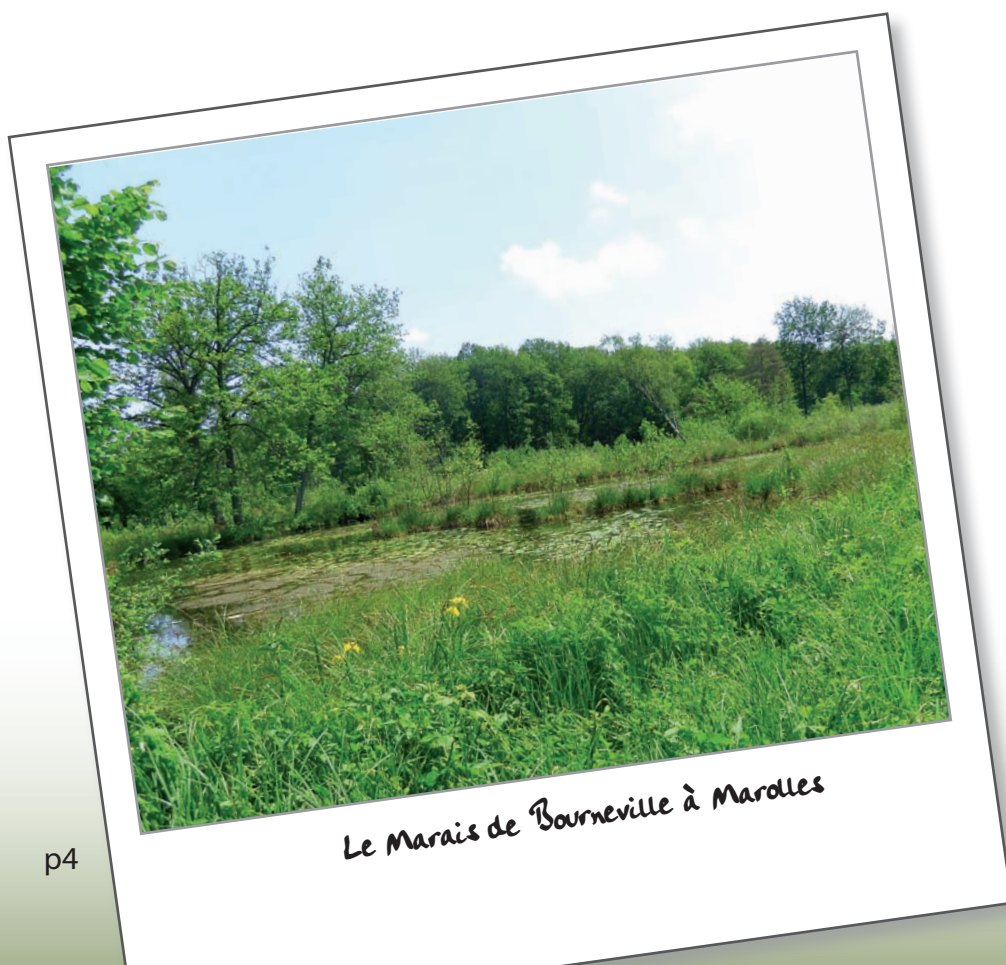
Le Marais de Bourneville à Marolles