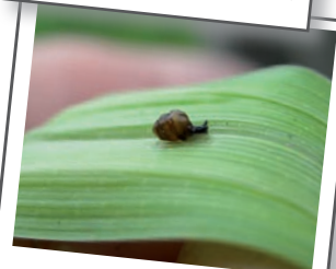
Le Vertigo de Des Moulins