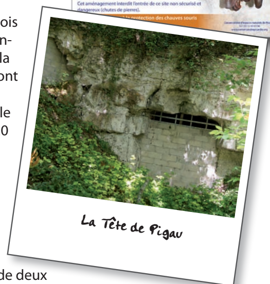
La Tête de Pigau