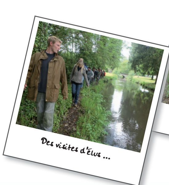
Des visites d'élus ...

En vallée de l'Automne se met en place depuis quelques années un partenariat avec le Syndicat d'Aménagement et de Gestion des Eaux du Bassin de l'Automne , qui a pour objet l'entretien, la restauration et l'amélioration de la qualité des cours d'eau et des eaux souterraines du bassin versant de l'Automne. Les cours d'eau et les milieux humides attenants étant indissociables, il paraissait naturel que les deux structures travaillent en commun, notamment pour coordonner leurs interventions. Une visite de sites gérés par le Conservatoire a également été organisée à l'initiative du SAGEBA en juin dernier, à destination des élus du bassin versant, afin de les sensibiliser à l'importance de la protection des cours d'eau et des zones humides.