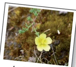
Le Fumana couché

La maîtrise d'usage du site est renforcée grâce à la signature prochaine d'un bail emphytéotique de 50 ans avec la commune. Sur le larris de Puisière, la découverte du Fumana couché suite aux travaux de gestion renforce l'intérêt patrimonial du site. Dans la cavité de la tête de Pigau, les chauves-souris sont toujours plus nombreuses en hibernation ! (voir bilan p 5).