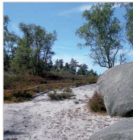
La Pierre glissoire

Relativement préservé depuis sa contractualisation en 2002, le site de la Pierre glissoire connaît depuis trois ans d'importantes dégradations liées notamment au passage interdit de motos ou de quads. Les lisses sont régulièrement détériorées et les plaques informatives abîmées. Le Conservatoire réfléchit à la possibilité d'aménagements complémentaires afin de prévenir au mieux ces dégradations et de laisser ce lieu accessible aux promeneurs respectueux.