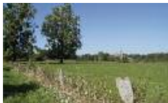
La Vallée d'Or à Babœuf (R. Monnehay)

Longtemps, l'homme a valorisé le fond des vallées en y fauchant les riches prairies humides et en y faisant paître son bétail. Les secteurs inondables des vallées et les prairies de fauche sont de plus en plus reconnus comme d'efficaces régulateurs de crues. Des programmes d'aide aux pratiques agricoles intégrant les enjeux environnementaux des territoires et la promotion d'usages de ces espaces, compatibles avec leur fonction d'expansion des crues et de maintien de la biodiversité, sont entrepris dans ces vallées alluviales.