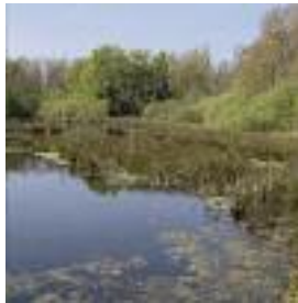
Beuvarde, Aisne (B. Couvreur)

La tourbe constituait une ressource non négligeable pour l'homme depuis des centaines d'années. Son extraction a formé dans certaines parties de nos vallées une mosaïque de petits étangs aux formes régulières. Mais l'abandon récent de l'extraction de la tourbe, des activités de pâturage, de coupe de bois et de fauche a engendré un embroussaillage des marais tourbeux. Ces zones humides, au contact de la terre et de l'eau, constituent de formidables réservoirs de biodiversité dans lesquels une multitude d'espèces animales et végétales se sont développées.