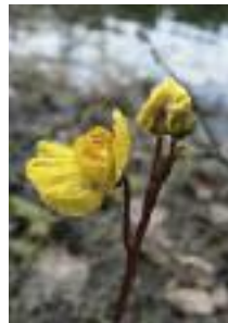
Utriculaire vulgaire (C. Hélie)

La mare est une étendue d'eau à renouvellement généralement limité, de taille variable. Sa faible profondeur permet à la lumière du soleil d'atteindre le fond, favorisant ainsi l'installation de nombreuses plantes aquatiques. Composantes importantes du paysage et du petit patrimoine rural, naturelles ou artificielles, les mares de Picardie présentent une multitude d'aspects : mare de village, points d'eau pour les bêtes sur les plateaux, mares forestières, mares de fond de vallée humide... Alimentée par les eaux pluviales et parfois phréatiques, la mare peut être associée à un système de fossés qui y pénètrent et en ressortent ; elle exerce alors un rôle tampon au ruissellement. Elle peut être sensible aux variations météorologiques et climatiques, et ainsi être temporaire (asséchée en été). La mare constitue un milieu naturel au fonctionnement complexe et présente des caractéristiques très variables (température, acidité ou dureté de l'eau, exposition à la lumière, profondeur, pentes, exposition aux polluants, proximité avec d'autres milieux naturels...). L'ensemble de ces facteurs détermine la flore et la faune qui s'y installent.