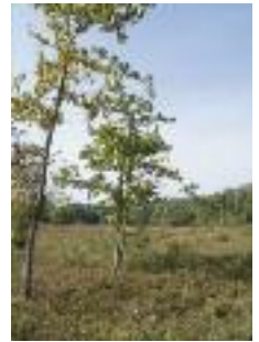
Landes humide à Versigny

Comme la majorité des landes, les landes humides sont le plus souvent issues du défrichement de terrains impropres à la culture. Aujourd'hui menacées par l'assèchement, l'embroussaillage, les plantations de résineux, l'envahissement par la Molinie et les bouleaux, ou encore la mise en culture, les landes humides sont très fragmentées, occupent de faibles superficies et sont souvent dégradées.