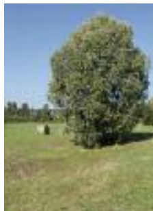
Prairies de Varesnes (R. Monnehay)

Les rivières Aisne et Oise, et leurs affluents, de même que l'Epte, s'écoulent au fond de larges vallées qui ont la particularité d'être fréquemment inondées. Redoutables pour les constructions implantées dans la zone d'expansion des eaux, ces inondations d'origine essentiellement naturelle, apportent aux milieux naturels semences et éléments nutritifs et favorisent l'épuration des eaux et le rechargement de la nappe alluviale. Les inondations de printemps favorisent la pousse d'une végétation caractéristique et très diversifiée. Au printemps et à l'automne, les prairies sont fréquentées par de nombreuses espèces d'oiseaux. Les bras morts et fossés, durablement submergés au printemps, sont propices à la reproduction du brochet et au développement de nombreuses libellules.