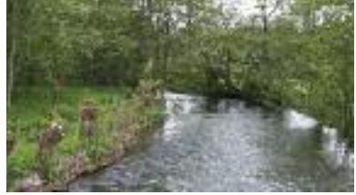
Le Thérain (R. Monnehay)

Un cours d'eau est l'endroit (en surface ou en souterrain) où s'écoule l'eau de façon continue ou temporaire. Ce sont aussi des sédiments fins et grossiers (vase, sable, graviers, cailloux, pierres...) qui sont entraînés de l'amont vers l'aval. La Picardie est sillonnée par des cours d'eau à faibles pentes, sauf au nord-est où courent de nombreux ruisseaux aux eaux vives. Les cours d'eau sont nombreux en Picardie et permettent d'accueillir bon nombre d'espèces. Depuis longtemps, l'Homme a bouleversé l'équilibre des rivières par le curage, le