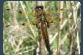
Libellule à quatre tâches (D. Top)

• Le bocage : une mosaïque de prairies, de haies, de vergers... à préserver : l'agriculture et l'élevage traditionnels assurent un maintien de ces paysages originaux dont il ne subsiste que de beaux ensembles en Thiérache et dans le Pays de Bray. Ces terroirs offrent ainsi des produits agricoles de qualité dont certains sont réputés. Sauriez-vous en citer quelques-uns ?