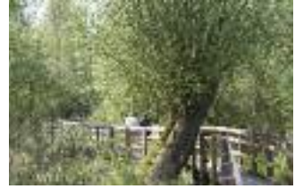
Visite d'un marais tourbeux de la Somme (R. Monnehay)

Depuis la fin de la période glaciaire (-10 000 ans), les eaux des plateaux se rassemblent au fond des vallées et des dépressions pour y former marais et tourbières. Les tourbières sont des zones humides (ou des marais) dont le sol est constitué de tourbe. La tourbe est un substrat très particulier, gorgé d'eau, et qui se constitue très lentement. Les tourbières fossiles ont ainsi plusieurs milliers d'années. La tourbe peut avoir plusieurs origines végétales :