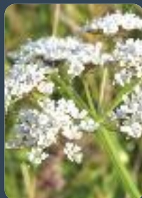
Enanthe à feuilles de Silaüs (portas... Licence C2.5)

• Des milieux naturels extrêmement intéressants et productifs : une faune (le discret Râle des genêts, la Cigogne blanche, les oies, vanneaux, pluviers dorés, bécassines, grues cendrées, le rare Cuivré des marais, les tritons et grenouilles, frayères à brochet...) et une flore riches (L'Inule des fleuves, la Pulicaire vulgaire, l'Enanthe à feuilles de Silaüs, le Butome en ombelle...), mais également une production importante de fourrage.