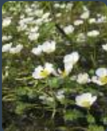
Renoncule aquatique (D. Frimin)

• Diversité d'espèces : Le Cincle plongeur, la Truite, le Caloptéryx vierge, le Chevalier guignette, le Cordulégastre annelé constituent de bons indicateurs des cours d'eau rapides au fond graveleux. Les Renoncules flottantes se trouvent dans les rivières rapides, souvent au niveau des radiers. La Bergeronnette des ruisseaux profite des édifices (ponts, barrages, lavoirs, moulins...) pour cacher son nid dans une anfractuosité. Dans une moindre mesure, le Cincle plongeur agit de même. En aval, les rivières tracent plus paresseusement leur sillon liquide. et cachent brochets et autres poissons d'eaux calmes (gardon, perche...), dont les plus petits font le régal du Martin-pêcheur. Un Chevalier guignette glisse au-dessus de l'onde et, dans un aulne, tambourine un Pic épeichette, le plus petit représentant de cette famille d'oiseaux.