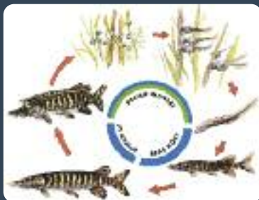
Extrait de la brochure "La plaine alluviale de l'Oise", CEN Picardie 1997 - dessins : D. Clavreul