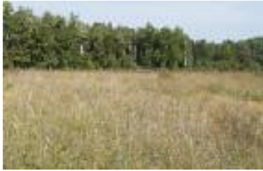
Réserve naturelle des Landes de Versigny

Les landes humides s'installent dans des dépressions, en bas des versants, à proximité de marais ou en contact avec des tourbières. Elles se développent sur des sols pauvres en éléments nutritifs, très acides, de type podzols, sur des roches-mères variées - souvent des couches de sables siliceux. Le sol est humide ou inondé pendant la plus grande partie de l'année mais un assèchement estival peut être observé. Si les sphaignes y sont abondantes et que la tourbe s'est