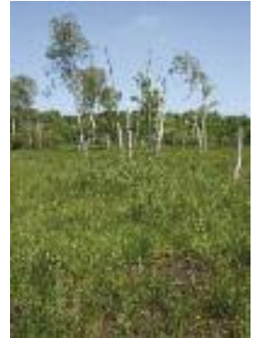
Prairie tourbeuse, vallée de l'Avre

exceptionnelles. La fauche et le pâturage y sont les principales activités agricoles. Le déclin de ces prairies humides est lié à l'abandon des modes de gestion traditionnels, au drainage et à l'intensification de l'agriculture en plaine (mise en culture, prairies artificielles, fauche plus précoce, fertilisations...).