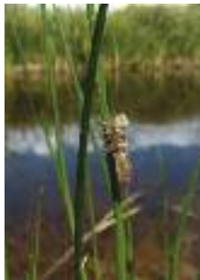
Exuvie (mue) de libellule

La mare est une étendue d'eau à renouvellement généralement limité, de taille variable. Sa faible profondeur permet à la lumière du soleil d'atteindre le fond, favorisant ainsi l'installation de nombreuses plantes aquatiques. Composantes importantes du paysage et du petit patrimoine rural, naturelles ou artificielles, les mares de Picardie présentent une multitude d'aspects : mare de village, points d'eau pour les bêtes sur les plateaux, mares forestières, mares de fond de vallée humide... Alimentée par les eaux pluviales et parfois phréatiques, la mare peut être associée à un système de fossés qui y pénètrent et en ressortent ; elle exerce alors un rôle tampon au ruissellement. Elle peut être sensible aux variations météorologiques et climatiques, et ainsi être temporaire (asséchée en été). La mare constitue un milieu naturel au fonctionnement complexe et présente des caractéristiques très variables (température, acidité ou dureté de l'eau, exposition à la lumière, profondeur, pentes, exposition aux polluants, proximité avec d'autres milieux naturels...). L'ensemble de ces facteurs détermine la flore et la faune qui s'y installent.