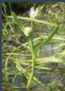
Rubanier nain (C. Hélie)

l'hiver, pour se reproduire dans les mares et les zones humides. Cette migration parfois spectaculaire est favorisée par une météo douce et humide. Lorsque les animaux traversent des routes, les populations de batraciens sont décimées. Des associations et des bénévoles se mobilisent pour installer des dispositifs permettant aux animaux de passer sans encombres. Voir l'opération Fréquence Grenouille menée par les Conservatoires d'espaces naturels :