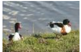
Tadornes de Belon (D. Top)

de vasières et d'immenses étendues de sable. Rarement inondées, les parties surélevées ("schorre" ou prés-salés) sont couvertes d'une végétation dense parsemée de multiples mares. Du Crotoy à Fort-Mahon, de grandes plages de sable rectilignes bordent un vaste massif dunaire dont certaines dunes peuvent atteindre 20 à 30 mètres de hauteur. Ce massif est ponctué de dépressions humides (ou "pannes") inondées. Baies, dunes, marais... tout concourt ici à une vie foisonnante !