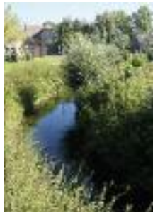
Pont-L'Évêque, Oïse (R. Monnehay)

recalibrage et la mise en place de seuils et de barrages, mais aussi par des usages parfois polluants : agriculture intensive, industries, urbanisation... D'importants progrès ont été accomplis : limitation des prélèvements, traitement et diminution des effluents urbains et industriels, entretien écologique des cours d'eau ménageant les rives, les zones de calme et les rapides, ou encore maintien des bancs de graviers propices à la reproduction des poissons. Reste à relever le défi de la reconquête morphologique des cours d'eau et à lutter contre des pollutions diffuses (azote, phosphore, pesticides, micropolluants).