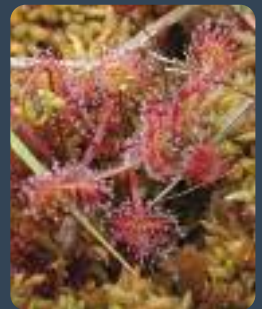
Rossolis à feuilles rondes (D. Top)

Le Rossolis à feuilles rondes est en effet une plante carnivore des landes humides picardes. Elle piège les insectes grâce aux poils visqueux qui recouvrent ses feuilles !