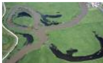
Bras-mort en formation (vallée de l'Oise) (D. Bardet)

végétation de vasières) et des espèces végétales et animales peu communes. Ils sont essentiels pour la reproduction de poissons (frayères) tels que le Brochet. Anciennes connexions entre marais, étangs et cours d'eau, souvent creusés pour le drainage, les fossés présentent également un intérêt pour la faune et la flore. Ils sont parfois envahis par des espèces exotiques comme la Jussie.