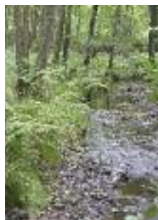
Ruisseau forestier (F. Bocca)