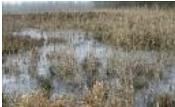
Prairie inondée (M.-H. Guistain)