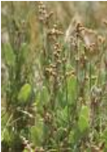
Obione (D. Top)

Malgré sa modeste étendue, le littoral picard égrène une incroyable diversité de paysages naturels et de zones humides. De Mers-les-Bains à Ault viennent mourir les ultimes falaises normandes qui, sous les assauts de la houle, du vent et de l'érosion libèrent leurs silex dans la mer. Roulés et arrondis, ces galets s'accumulent sur 16 km, l'un des plus grands cordons de galets d'Europe. À l'abri de cette mouvante muraille de pierres, ou en retrait du massif dunaire du Marquenterre, s'étendent de vastes étendues planes, les bas-champs ou renclôtures, soustraits à l'influence de la mer grâce à la construction d'une série de digues.