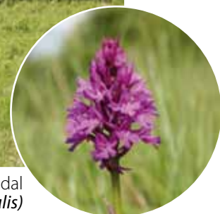
L'Orchis pyramidal ( Anacamptis pyramidalis )