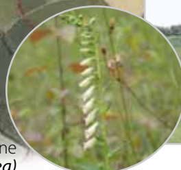
La Digitale jaune ( Digitalis lutea )