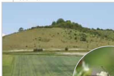
Le Machaon ( Papilio machaon )

Cet éperon calcaire, structure géologique remarquable dans le Pays de Bray, est le site emblématique et le plus riche en espèces de la réserve.