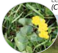
Le Populage des marais ( Caltha palustris )