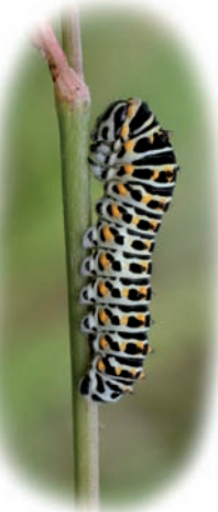
Chenille du Machaon

Plus d'une centaine d'espèces de papillons de jour ont été recensées en Picardie. Certaines d'entre elles sont aujourd'hui menacées de disparition, d'autres ont déjà disparu et d'autres sont arrivées récemment. Les menaces qui pèsent sur les papillons sont nombreuses : destruction de l'habitat des chenilles et des imagos*, isolement des populations par la fragmentation des milieux naturels, raréfaction de plantes-hôtes* pour les espèces les plus spécialisées, utilisation de pesticides, parasitisme... Le Conservatoire d'espaces naturels de Picardie met en œuvre des actions en faveur de la conservation des habitats et des nombreuses espèces rares et menacées qui leur sont associées. Il conduit des études dans le but d'améliorer les connaissances sur l'écologie de plusieurs espèces et le fonctionnement de leur population. Puis, il met en place des actions de gestion sur les sites favorables à la conservation et au développement du patrimoine naturel dont les papillons bénéficient. Il accompagne la mise en place de divers projets et mesures dans l'objectif de restaurer des continuités écologiques permettant les échanges entre les différentes populations. Avec la présence de 95% des espèces menacées en