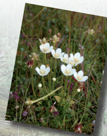
La Parnassie des marais