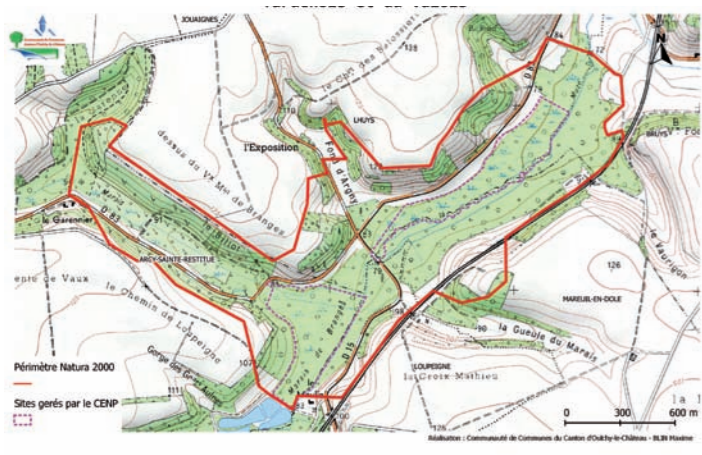
Le secteur ouest du site Natura 2000

En 2012, la Communauté de Communes et le Conservatoire ont ainsi recensé les différents propriétaires du périmètre Natura 2000 afin de leur présenter le DOCOB et de voir avec eux ce qu'ils étaient en mesure de réaliser pour la préservation et l'entretien de ces milieux remarquables.