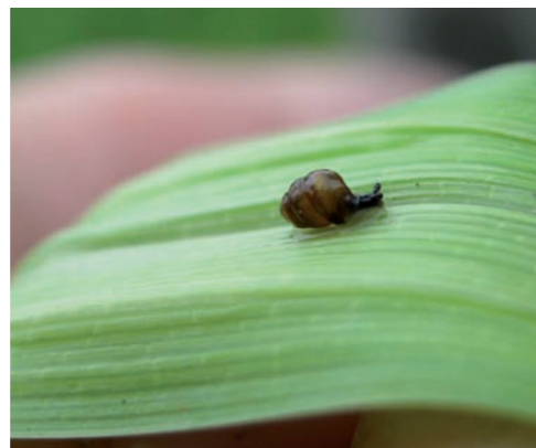
Le Vertigo de Desmoulins (espèce d'intérêt communautaire)