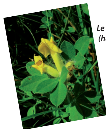
Le Cytise couché, espèce des pelouses calcaires (habitat d'intérêt communautaire)

La Communauté de Communes et le Conservatoire ont notamment proposé la mise en place de Contrats Natura 2000 à différents propriétaires privés sur ce secteur.