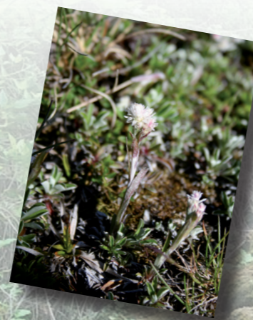
Le Pied de chat