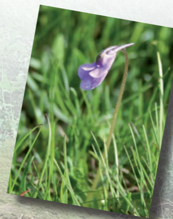
La Grassette commune