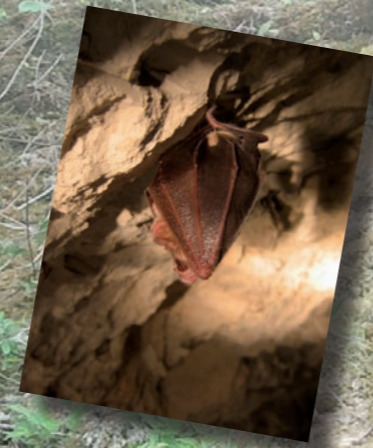
Le Grand Rhinolophe, espèce d'intérêt communautaire