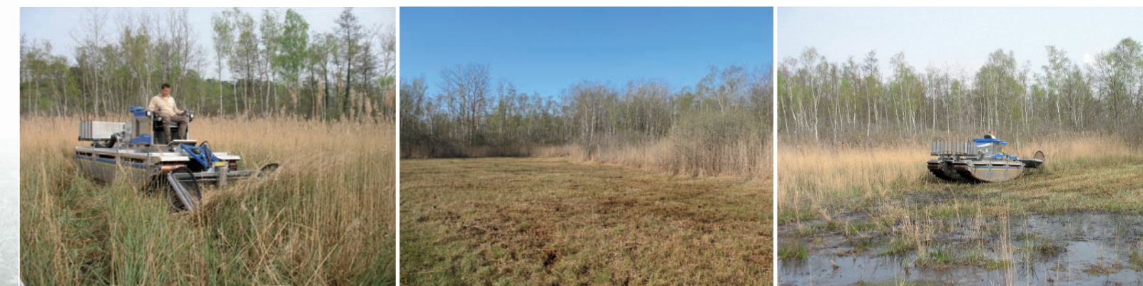
Le truxor permet d'entretenir le marais par une fauche exportatrice

Sur le site de Branges, une opération de fauche exportatrice a été testée avec un engin amphibie, le Truxor. Cette opération couplée avec une coupe manuelle préalable des arbustes donne de très bons résultats écologiques. Par exemple deux espèces floristiques à enjeux sur le site ont vu leur population multipliée (par 10 pour la Grassette commune et par 3 pour la Parnassie des Marais).