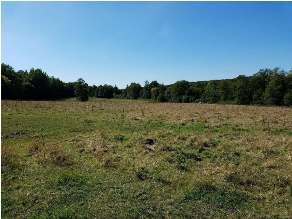
Prairies de fauche