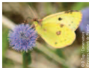
Le Fluoré : Ce papillon affectionne les friches ensoleillées, les milieux ouverts ou rocailleux secs en altitude. Sur le verso, le mâle est jaune fluoré alors que la femelle est blanche et tous deux ont l'apex de l'aile antérieure arrondi, noir taché de clair et un point noir. Le revers est jaune chez le mâle et la femelle, celle-ci ayant l'aile antérieure plus blanche.

dégage donc une odeur assez forte. Vous reconnaîtrez aussi peut-être la Carline, la rare et délicate Epipactis brun rouge, cette orchidée sauvage qui fleurit en mai-juin, ou plus tard en saison le violet de la Gentiane d'Allemagne. Continuez l'ascension en prenant à droite, et suivez le sentier en épingle qui vous mène dans un sous-bois. Vous trouverez 20 mètres plus loin