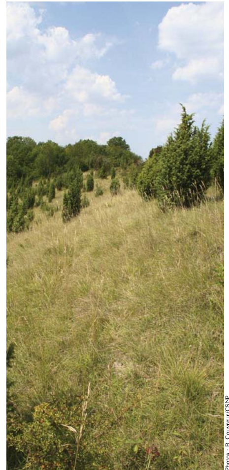
Les coteaux de Baybelles à Rocquemont