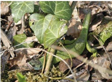
Un lézard vert tente de se camoufler : c'est raté, on t'a repéré ! Le lézard vert se trouve chez nous en limite nord de répartition, il est présent à Rocquemont.