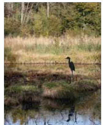
N'est-ce vraiment qu'une silhouette ?

En 2010 a été réalisée la seconde phase d'aménagement du sentier de découverte du marais de Bourneville à Marolles (60). La première phase avait permis une meilleure accessibilité piétonne par la mise en place d'un platelage et de passerelles.