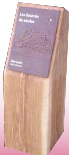
Bornes en braille à la RNN de l'Etang Saint-Ladre