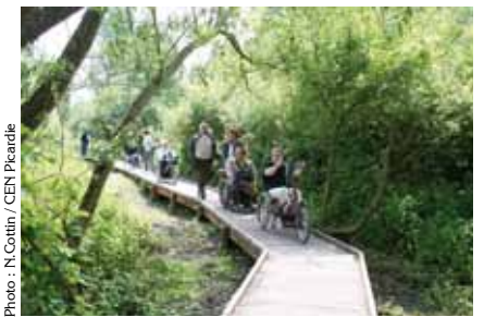
Aménagement de la RNN de l'Etang Saint-Ladre