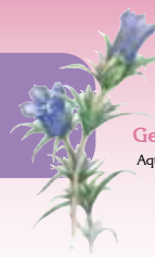
Gentiane pneumonanthe Aquarelle : N.Leguillouzic