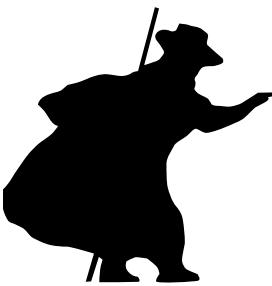
Le Petit Léon guide les visiteurs

La seconde phase consistait à mettre en place les aménagements visuels : des silhouettes discrètes et intégrées dans le paysage (héron, grenouille, libellule, tourbier, utriculaire et nénuphar) invitent le visiteur à découvrir le patrimoine du site, tandis que des bornes signalétiques le guident à travers le marais. Enfin, le panneau d'accueil du site a été actualisé. Ce sentier s'appuie sur un conte réalisé par les enfants de l'école communale en 2008, assistés d'une conteuse professionnelle, disponible en livret auprès de la mairie ou du Conservatoire.