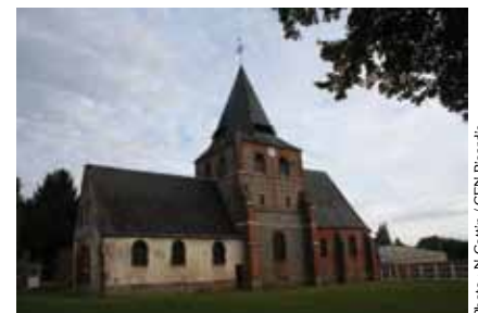
Eglise de Fontaine-Lavaganne

Ce mois de mars a vu l'aménagement d'une majorité des ouvertures de l'église de Fontaine-Lavaganne pour faciliter l'appropriation des combles par les chauves-souris tout en empêchant les pigeons domestiques d'y accéder.