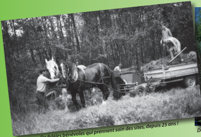
De fidèles bénévoles qui prennent soin des sites, depuis 25 ans ! (M.-M. Molinier)