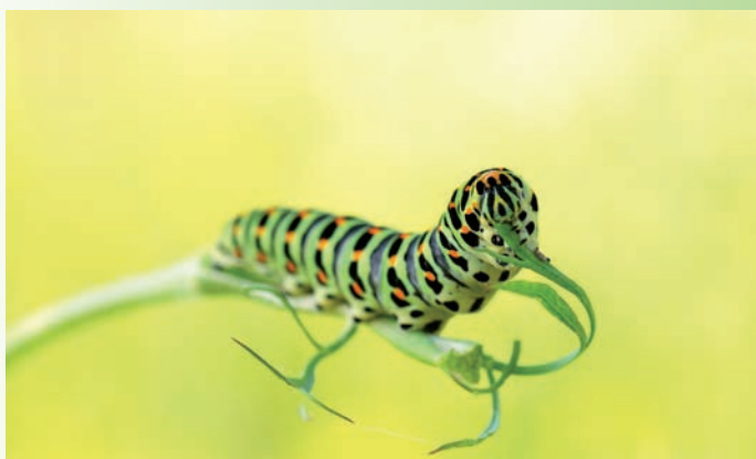
1er prix Adhérents / catégorie «Espèces faunistiques ou floristiques observées sur un site du Conservatoire» : Patrick Carliez, chenille de Machaon, Varesnes (Oise, vallée de l'Oise)