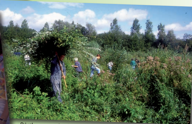
Développement des chantiers nature avec les bénévoles