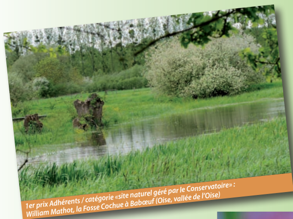
1er prix Adhérents / catégorie «site naturel géré par le Conservatoire» : William Mathot, la Fosse Cochue à Babœuf (Oise, vallée de l'Oise)