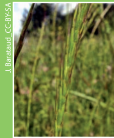
J. Barataud, CC-BY-SA