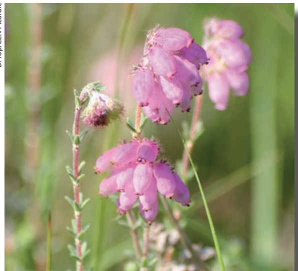
D. Top/CEN Picardie