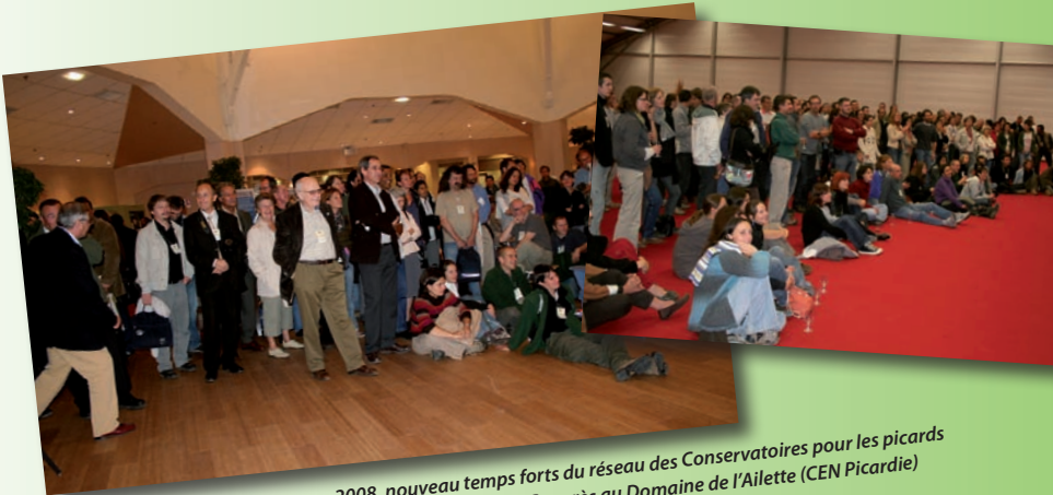
2008, nouveau temps forts du réseau des Conservatoires pour les picards avec l'organisation du Congrès au Domaine de l'Ailette (CEN Picardie)