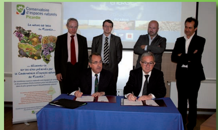
2012, le Conservatoire d'espaces naturels de Picardie est agréé par l'Etat et la Région Picardie (R. Monneyhay)