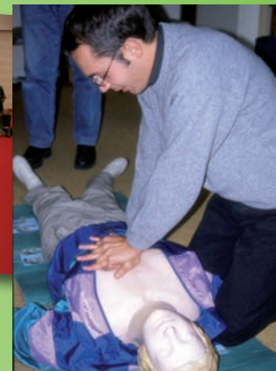
Les nécessaires séances de formation aux premiers secours pour l'équipe (CEN Picardie)