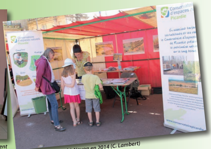
Un stand à Noyon en 2014 (C. Lambert)