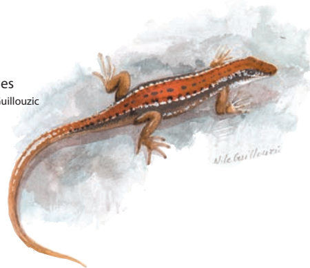
Lézard des murailles aquarelle de Noëlle Le Guillouzic

le milieu naturel, provoquant la régression des landes.