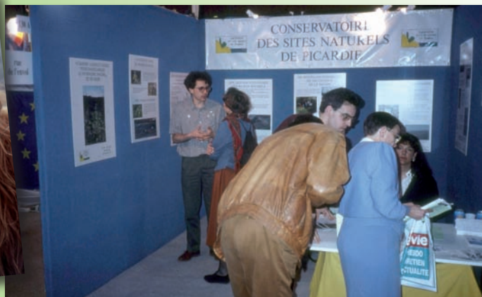
Les premiers stands de présentation du Conservatoire - Espaces 1901 en 1992