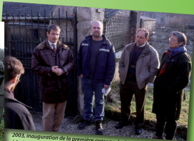
2003, inauguration de la première antenne du Conservatoire dans l'Aisne, à la ferme pédagogique du CPIE des Pays de l'Aisne (CEN Picardie)