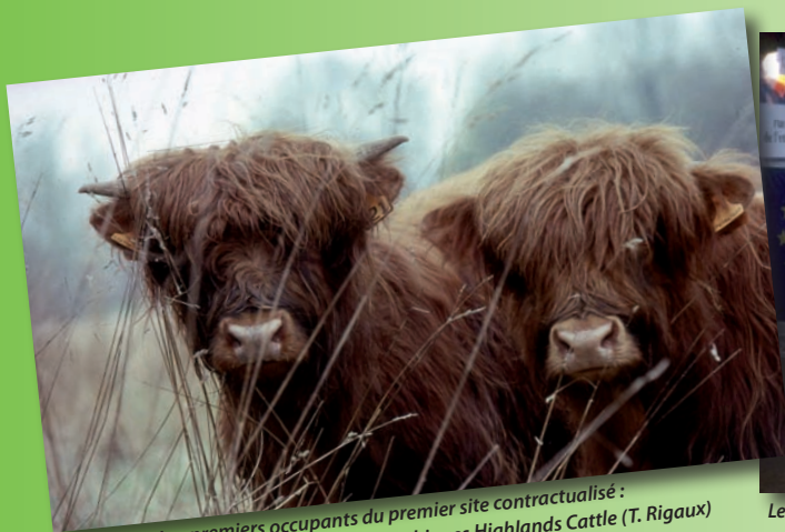
Les premiers occupants du premier site contractualisé : la vallée d'Acon et ses sympathiques Highlands Cattle