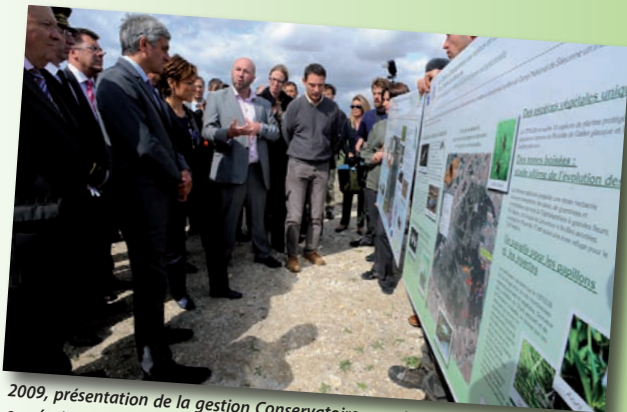
2009, présentation de la gestion Conservatoire au ministre Hervé MORIN et à la secrétaire d'état Chantal JOUANNO au Camp militaire de Sissonne