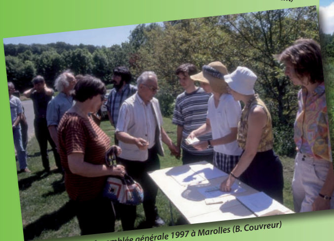
Assemblée générale 1997 à Marolles (B. Couvreur)