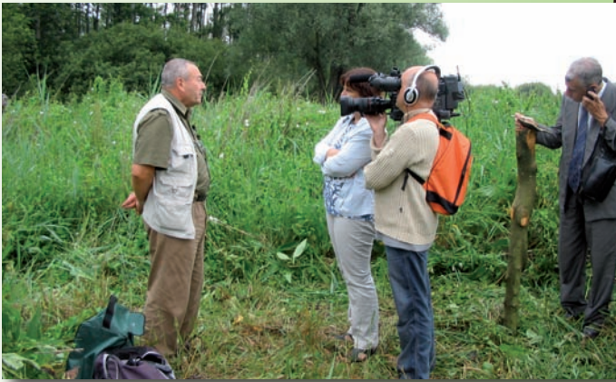
2005, tournage d'un documentaire sur les emplois «tremplins» (CEN Picardie)