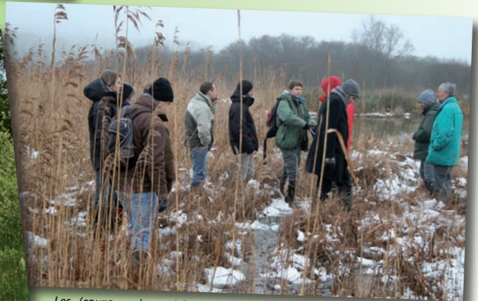
Les (courageux) participants à la Conférence Technique Thématique scientifique que le Conservatoire picard a accueillie en 2013