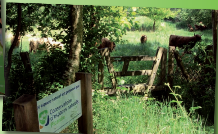
Les Highlands Cattle pâturent les landes à Saint-Germer-de-Fly sur un beau réseau de sites «préservés par le Conservatoire d'espaces naturels de Picardie» (L. Lemaire)