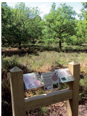
Trièdre pédagogique installé sur le sentier des 3 Hiboux en 2014

Situé au sein du Parc Astérix, en propriété privée, le site est géré par le Conservatoire et n'est visitable que lors des sorties nature ou par la clientèle de l'Hôtel des 3 Hiboux situé dans l'enceinte.