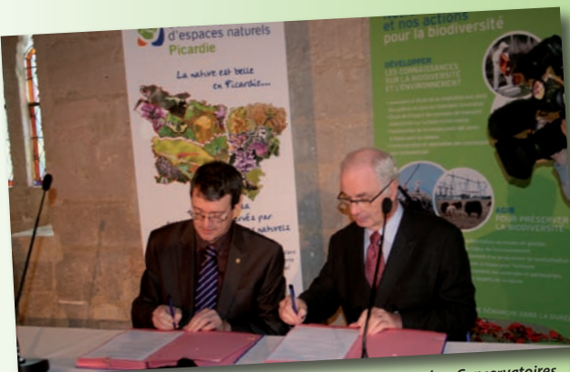
2013, signature d'une convention entre la fédération des Conservatoires d'espaces naturels et RTE - actions engagées en Picardie