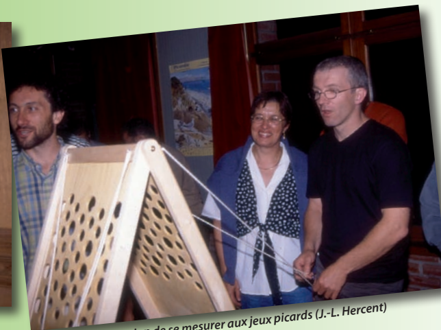
L'occasion de se mesurer aux jeux picards (J.-L. Hercent)