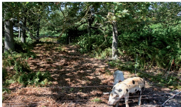
Lutte contre la Fougère aigle par le pâturage des cochons

Depuis quelques années, les moutons d'éleveurs partenaires participent à l'entretien du site au printemps. Le pâturage par des cochons est également testé ici depuis 2012 pour freiner l'invasion de la Fougère aigle. Sur une mare située dans la lande humide, la gestion a permis le retour d'un cortège floristique et faunistique exceptionnel, dont la Leucorrhine à gros thorax et l'Eléocharide à tiges nombreuses.