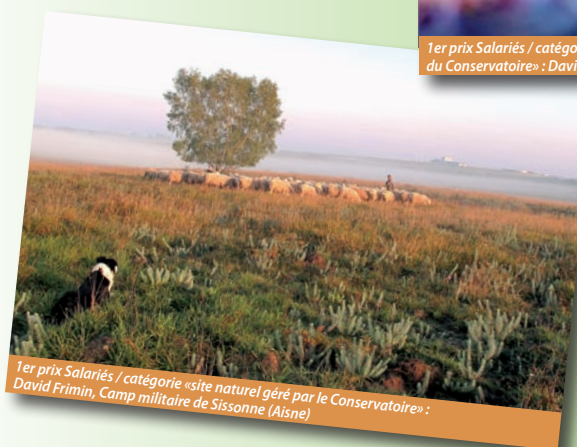
1er prix Salariés / catégorie «site naturel géré par le Conservatoire» : David Frimin, Camp militaire de Sissonne (Aisne)