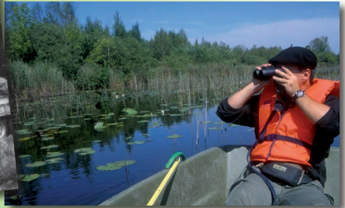
Des découvertes naturalistes chaque année (J.-C. Hauguel)