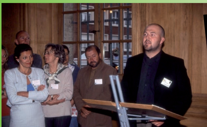
2002, le Conservatoire organise son premier Séminaire des Conservatoires d'espaces naturels à Amiens. Ici, accueil à l'Hôtel de Ville (J.-L. Hercent)