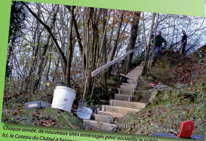
Chaque année, de nouveaux sites aménagés pour accueillir le public. Ici, le Coteau du Châtel à Feigneux en 2001 (V. Garnero)