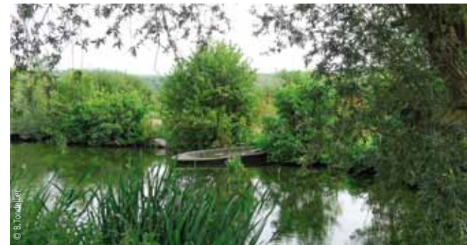
Un paysage façonné par l'Homme

Une fois le pont atteint, empruntez le chemin à droite qui longe la rivière L'Eauette. Il vous mène dans une partie plus boisée des marais, à l'ambiance plus confinée et secrète. L'Eauette est le nom donné au dernier tronçon de L'Airaines, longue de 13 km seulement, qui est une rivière de première catégorie piscicole : on y rencontre truites et chabots.