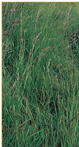
Graminée reconnaissable par les grandes touffes hautes et souvent jaunies qu'elle forme sur le sol, le Brachypode penné fait ici concurrence à la flore des pelouses rases en les étouffant et en préparant le terrain pour l'arrivée des arbustes.

Conséquence de l'abandon du pâturage mené sur le Mont Florentin jusque dans les années 1980, une autre végétation dominante apparaît peu à peu : "l'ourlet". Ce dernier présente de hautes herbes conquérantes et banales dont le Brachypode penné est l'un des plus grands représentants.