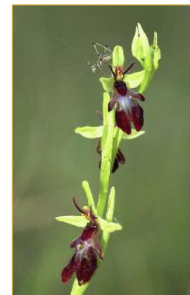
Parmi la douzaine d'espèces d'orchidées inventoriées sur le site, l'Ophrys mouche a développé une stratégie des plus efficaces pour attirer l'insecte pollinisateur : chacune de ses fleurs imite le corps d'un insecte.

Jadis, les pelouses étaient utilisées pour le pâturage des moutons. Ces derniers jouaient le rôle de "tondeuses" naturelles, entretenaient ainsi le milieu et favorisaient de nombreuses espèces animales et végétales. Peu à peu délaissées par les activités agricoles, puis envahies par les arbustes et les bois, les pelouses ne représentent plus, aujourd'hui, en Picardie, que 5 % des superficies qu'elles comptaient au début du vingtième siècle.