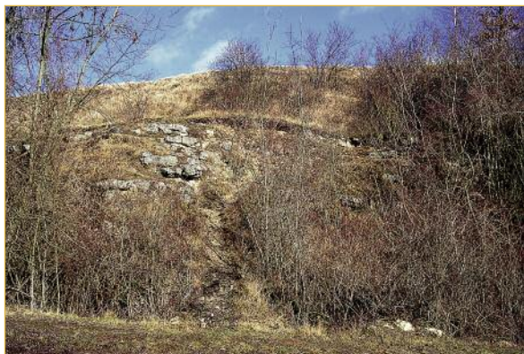
Les pentes qui bordent le Plateau sont en majorité boisées. Il subsiste néanmoins des pelouses rases intéressantes entre les affleurements de calcaire.

C'est la mosaïque des milieux naturels qui caractérise le Plateau de Lavilletterte et lui procure toute sa richesse. Elle permet à de nombreuses espèces d'y trouver le gîte et le couvert. Dès le printemps, une promenade discrète et attentive permet des rencontres avec des criquets et des sauterelles affairés dans les herbes rases ou avec des papillons impatients de profiter du nectar de chaque fleur. Une agitation dans une touffe d'herbes trahit la présence du Lézard vert, venu prendre un bain de soleil.