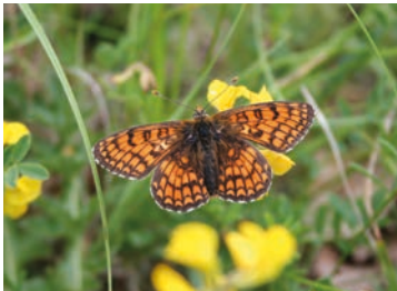
La Mélitée des scabieuses

Découvertes lors de précédents inventaires, de nouvelles parcelles aux fortes potentialités ont été inventoriées. L'une d'elle présente un cortège de papillons de jour remarquables. En effet, 4 papillons patrimoniaux y ont été observés. Il s'agit de l'Azuré de l'ajonc dont seul le versant sud de la colline constituait un lieu avéré de présence, ce qui fait de cette parcelle la deuxième station connue pour l'Oise. On y trouve également l'Argus frêle, l'Hespérie de la Sanguisorbe mais aussi la Mélitée des Scabieuses qui fait de Saint-Pierre-ès-Champs l'unique bastion de l'espèce en Hauts-de-France.