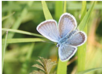
L'Azuré de l'ajonc