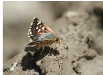
L'Hespérie de la Sanguisorbe