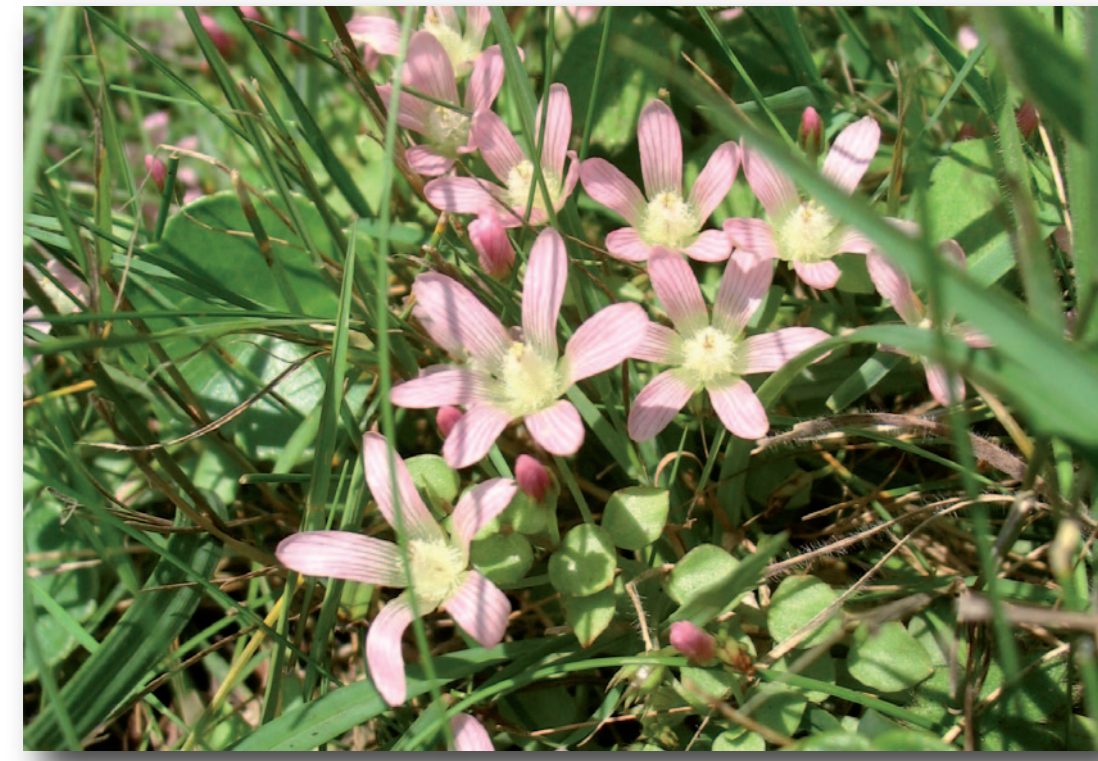
Dernier témoin des milieux tourbeux, le Mouron délicat trouve ici, sur les berges, l'un de ses derniers refuges dans la Vallée de l'Aronde. Devenue rare, cette espèce est protégée en Hauts-de-France.

Les tourbières de Braisnes, propriétés communales préservées et gérées par le Conservatoire d'espaces naturels, sont des zones humides d'intérêt départemental pour la conservation de la flore des tourbières alcalines. Anciennement exploités pour la tourbe dans les années 1930, ces étangs ont aujourd'hui une vocation piscicole. Il y subsiste une biodiversité typique des anciennes tourbières qu'il convient de préserver au sein d'une vallée de l'Aronde largement plantée de peupliers.