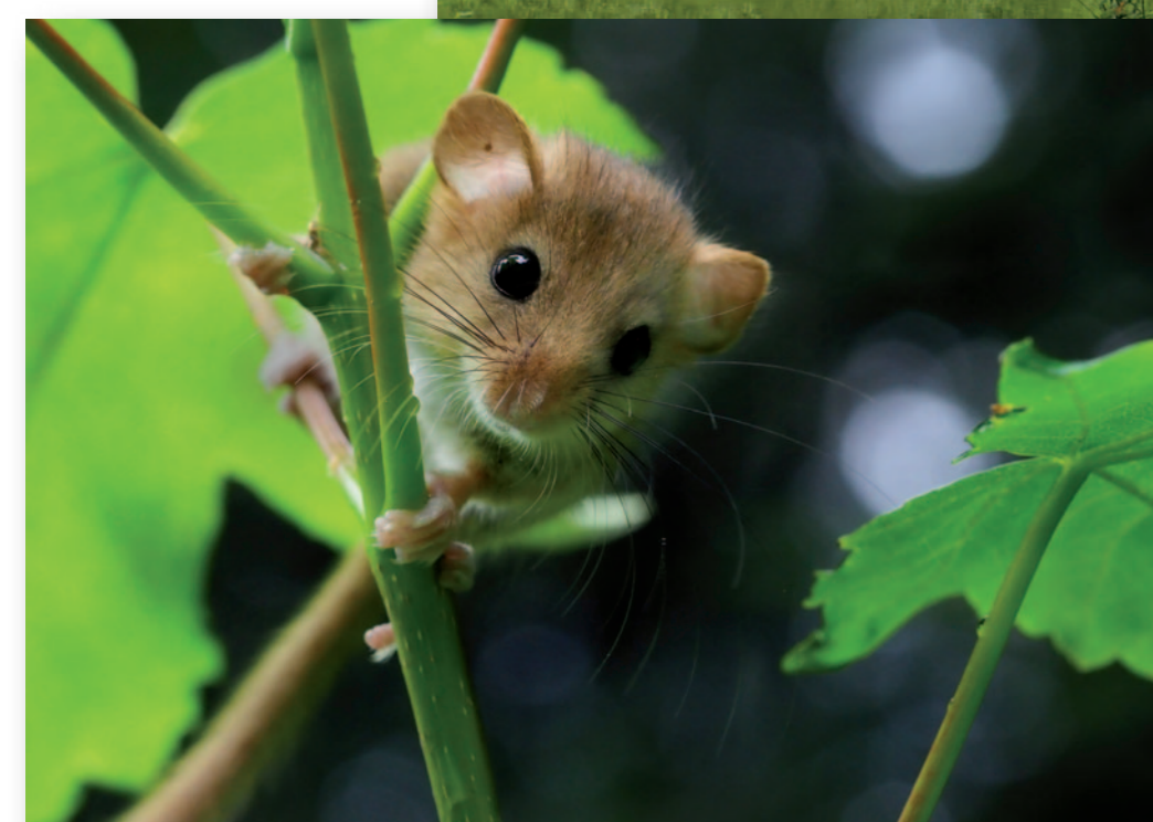
Le Muscardin habite les fourrés arbusitifs dans lesquels il construit son nid en forme de boule avec des herbes sèches. Soyez attentif et patient pour l'observer !

L'eau est une ressource clé sur le site. Elle joue un rôle essentiel tant sur le rôle fonctionnel que celui de réservoir de biodiversité. Afin de restaurer des surfaces favorables aux espèces spécifiques des bas-marais alcalins, des travaux de gestion ont été réalisés par le Conservatoire et se poursuivent aujourd'hui : étrepage, mise en défens, fauche... L'association de Pêche et de Protection des Milieux Aquatiques (APPMA) de Compiègne et la Fédération Départementale des Associations Agréées pour la Pêche et la Protection des Milieux Aquatiques de l'Oise (FDAAPPMA) et leurs bénévoles participent grandement à cette restauration.