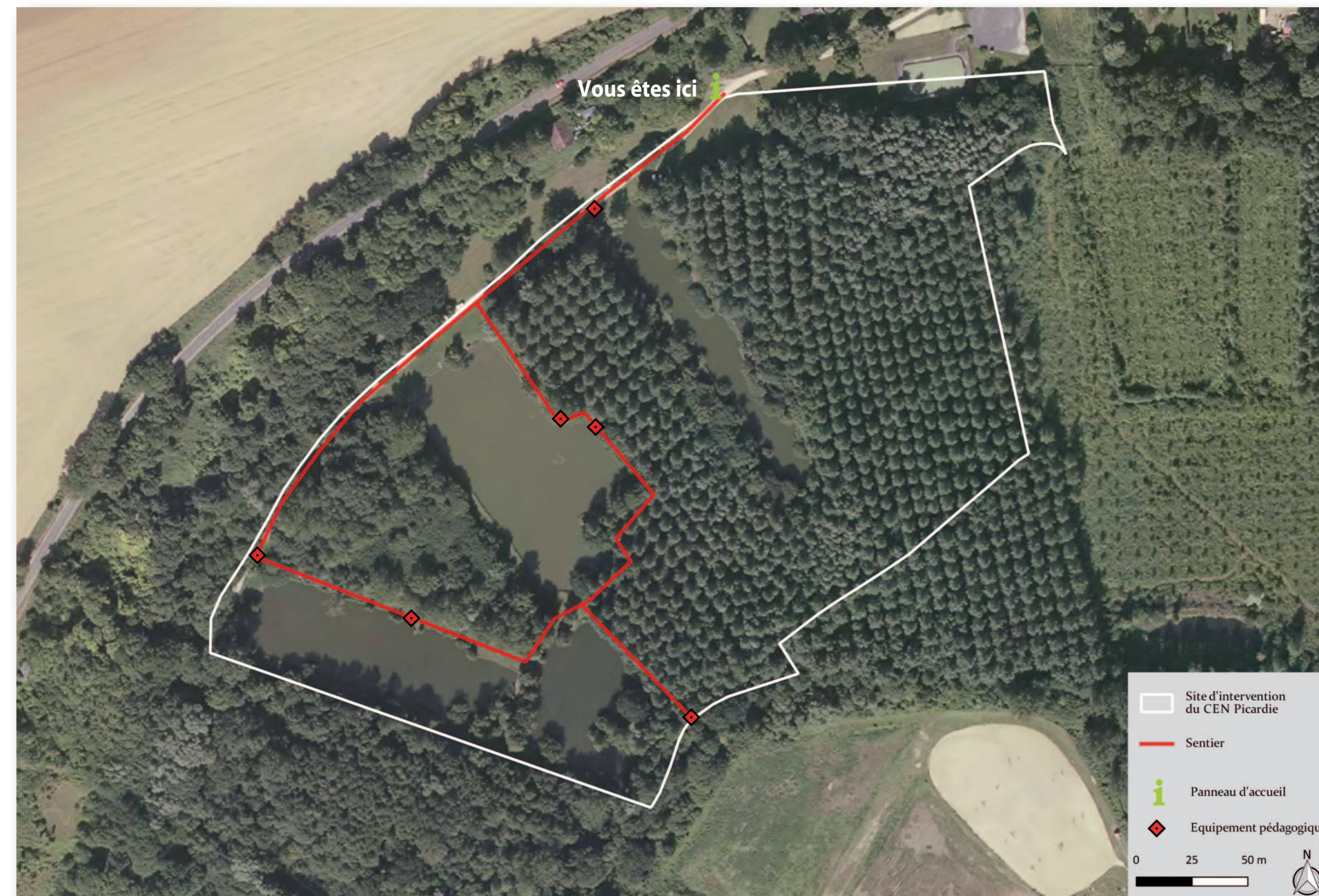
Photographie aérienne des étangs de Braisnes-sur-Aronde : le sentier pédagogique.