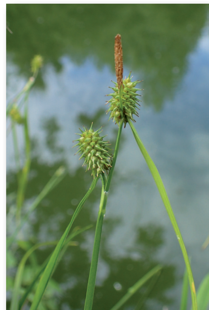
Ressemblant à une herbe située en bord de berge, la Laiche Jaune est typique des bas-marais tourbeux alcalins. Des mesures de gestion permettent de la protéger sur le site.

Les étangs piscicoles de Braisnes-sur-Aronde jouent un rôle dans la préservation des espèces des zones humides et abritent de nombreuses espèces comme le très coloré Martin-Pêcheur d'Europe, les odonates ("Libellules") qui égayent les lieux lors des journées ensoleillées ou encore le Muscardin, petit mammifère qui se cache dans les fourrés en bordure des boisements. Le sol tourbeux gorgé d'eau et des conditions de vie particulières expliquent la présence d'espèces végétales de grand intérêt patrimonial : le Mouron délicat, le Troscart des marais, la Laiche jaune, la Laiche distante... Malgré la faible superficie de cet habitat situé principalement le long des berges, les tourbières concentrent une biodiversité originale, riche et menacée. Ouvrez l'œil !