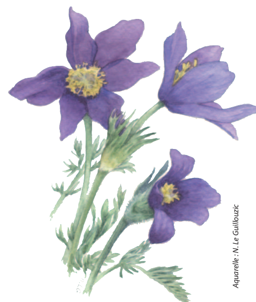
Aquarelle : N. Le Gallouac