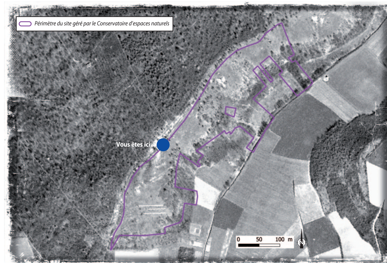
Photographie aérienne de 1951 montrant quelques points sombres de boisements au sein de vastes surfaces herbacées, plus claires. La situation est aujourd'hui inversée, les pelouses ayant été envahies par ces boisements.