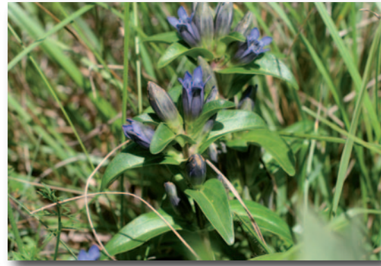
La Gentiane croisettes, une espèce vulnérable, possède son dernier bastion de la vallée sur le larris. Elle est protégée en région Hauts-de-France.

Le larris de Bellevue, site géré par le Conservatoire d'espaces naturels, est la co-propriété de la commune de Béthisy-Saint-Pierre et du Conservatoire. Il se situe aux portes de la forêt domaniale de Compiègne. C'est un des nombreux larris qui parsèment encore les versants de la vallée de l'Automne. Le terme picard "Larris" désigne un coteau calcaire à la végétation herbacée rase : un paysage original à découvrir !