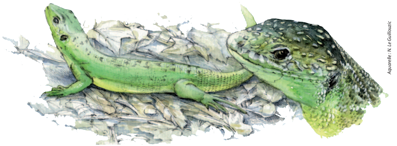
Le Lézard à deux raies (anciennement nommé Lézard vert) est le plus gros lézard de la Région. La vallée de l'Automne constitue une de ses limites nord de répartition au niveau national.