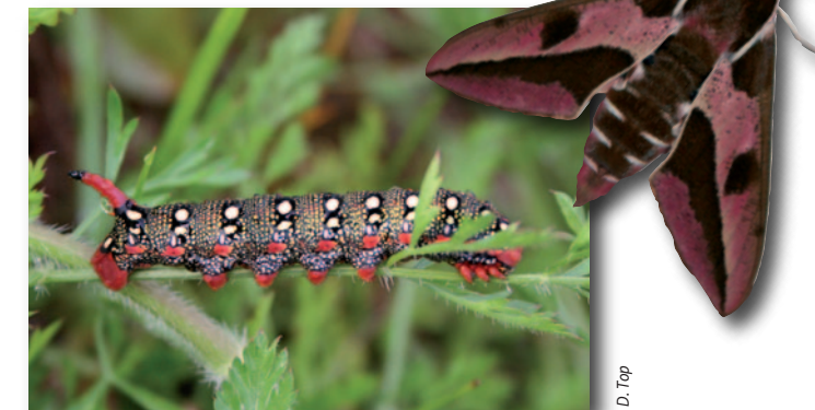
Sur le coteau de Bellevue, la chenille du Sphinx de l'Euphorbe se nourrit de l'Euphorbe petit-cyprès, une plante des larris.