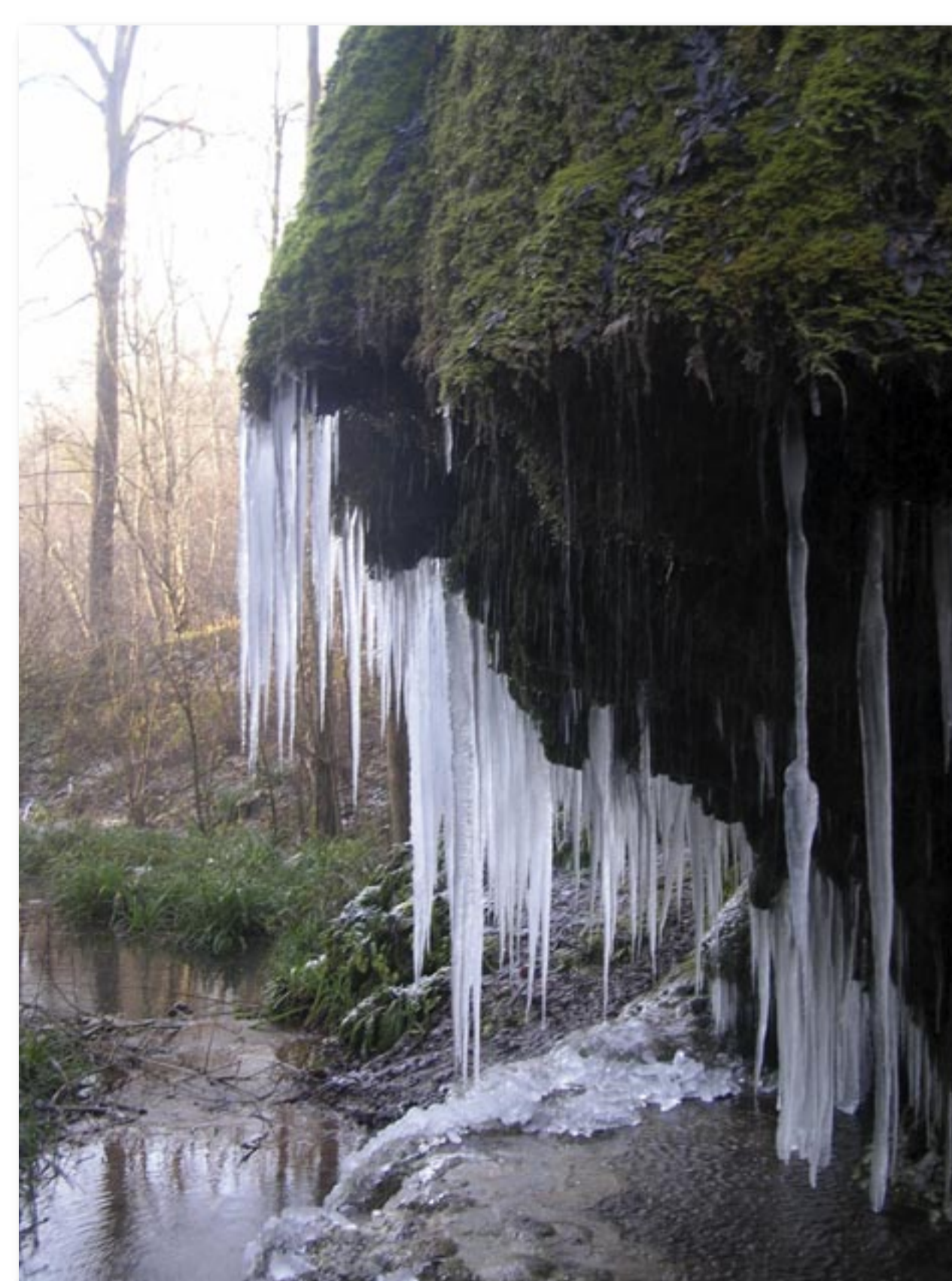
Appelée aussi « Roche pleureuse », cette curiosité géologique dévoile parfois des stalactites de glace au cœur de l'hiver.

Promenade, découverte du patrimoine naturel, activités cynégétiques, la Fontaine Saint-Martin est un site aux multiples usages avec toujours un seul mot d'ordre : le respect de la nature ! Et parce que préserver la nature n'est pas la mettre sous cloche, le propriétaire a pris l'initiative de laisser le site accessible au public. En 2020, en partenariat avec le Conservatoire, un sentier agrémenté de panneaux est créé.