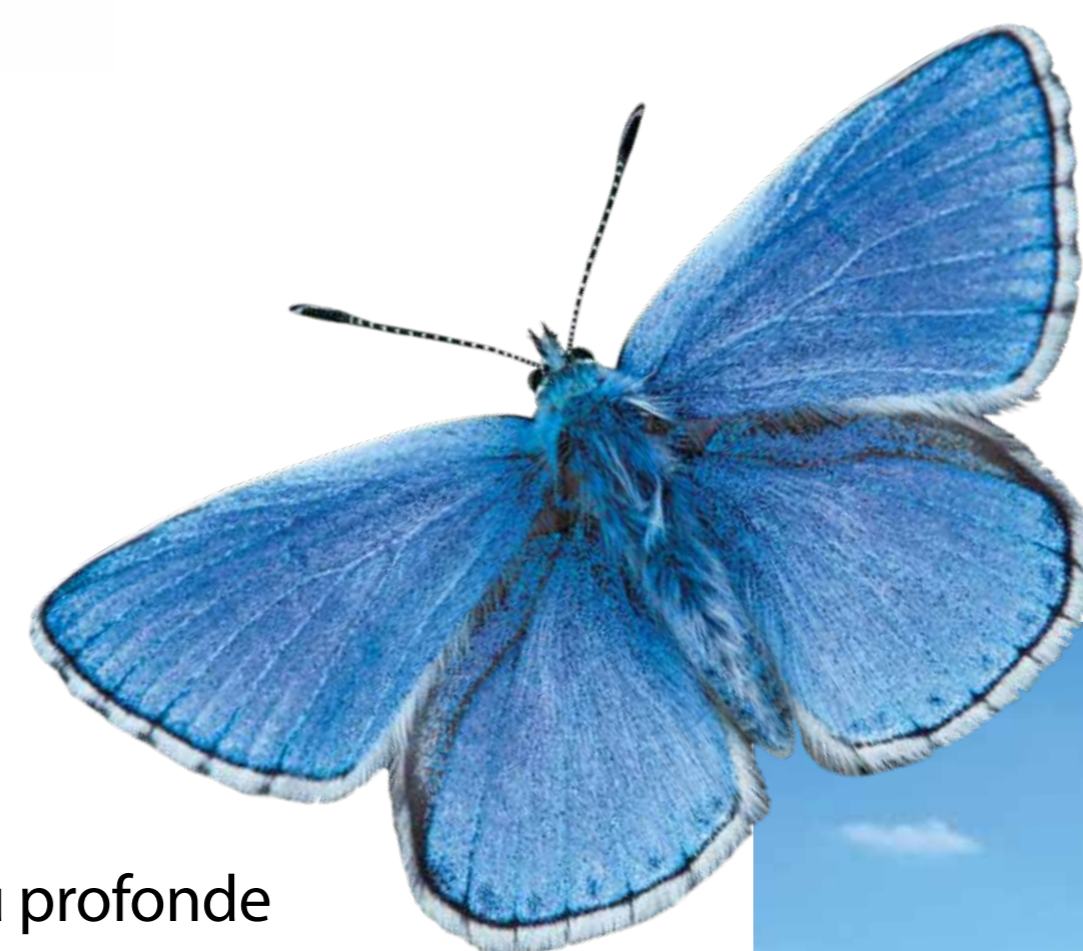
← Le papillon Azuré bleu-céleste (mâle)

Rejoignez le Conservatoire et adhérez en ligne : cen-hautsdefrance.org/adherer Le Conservatoire d'espaces naturels des Hauts-de-France est membre du réseau national des Conservatoires d'espaces naturels. Retrouvez toutes nos animations sur :