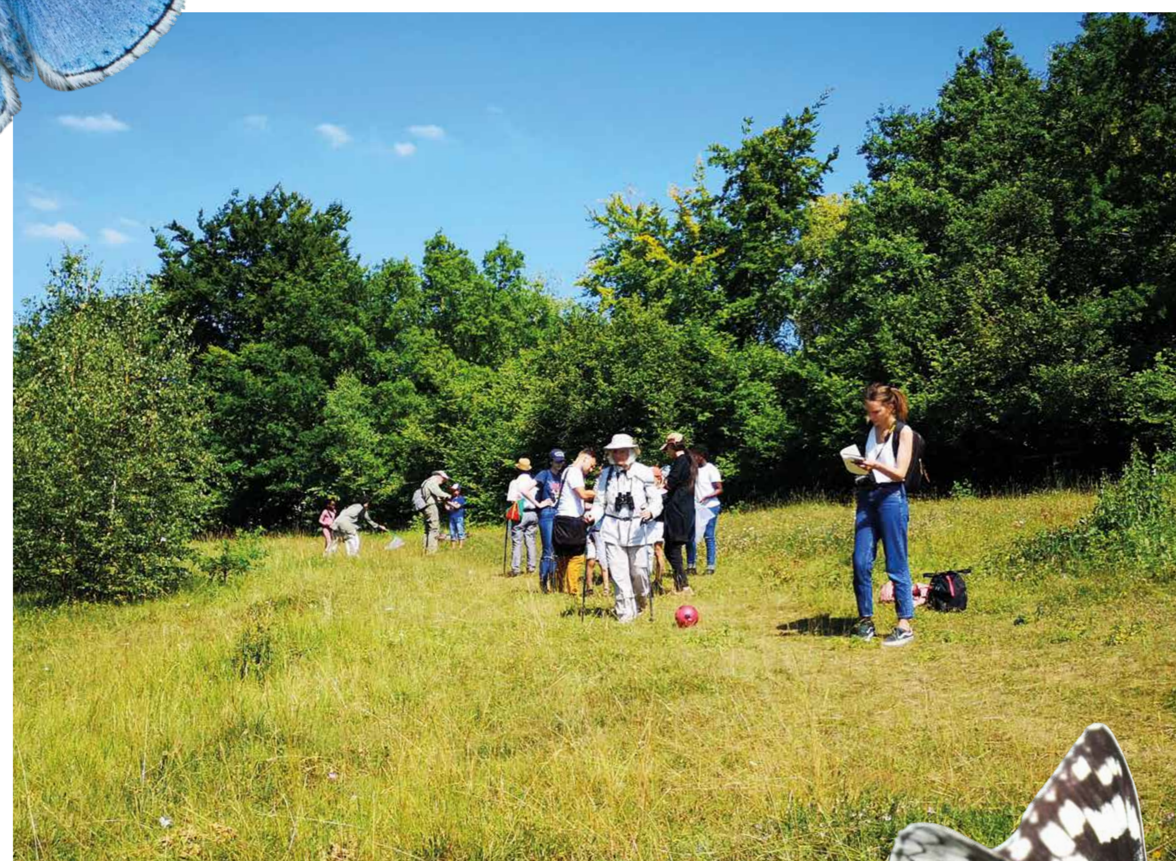
Le papillon Demi-deuil →