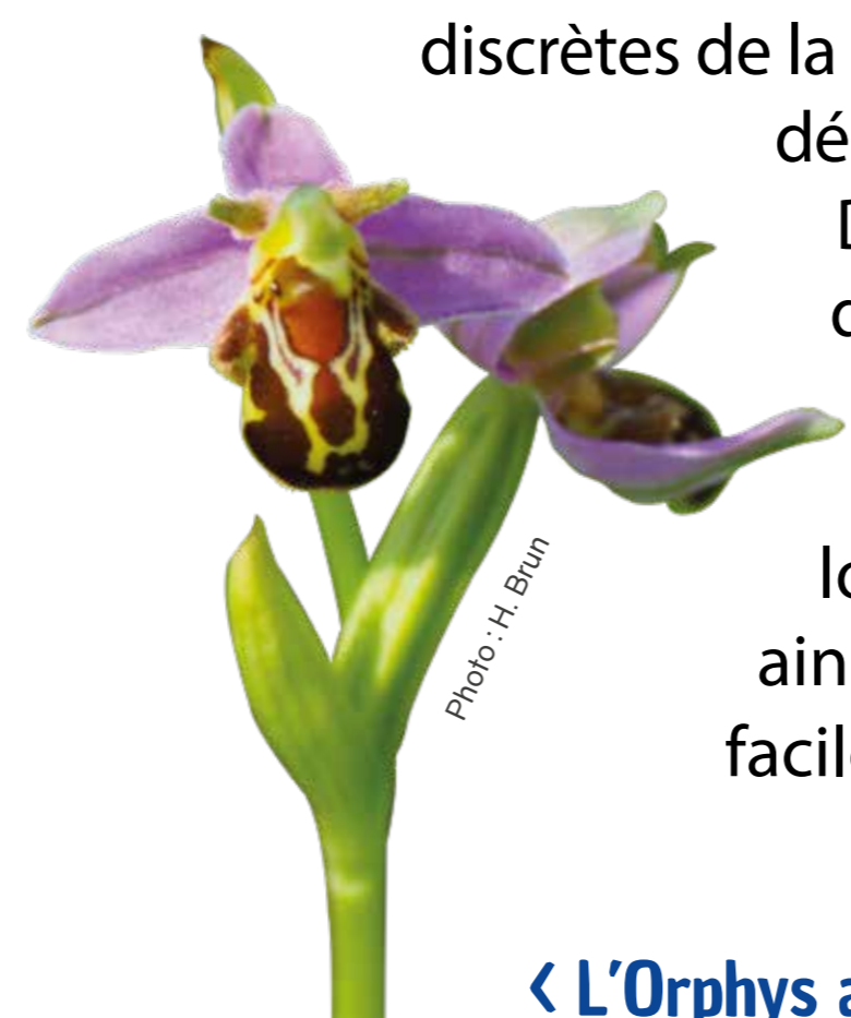
← L'Ophrys abeille

Des orchidées sauvages trouvent également des conditions favorables sur le coteau tel que l'Ophrys abeille qui fleurit d'avril à juin dans notre région. En été vous croiserez des papillons d'un bleu éclatant, de la famille des Azurés, ainsi qu'un papillon noir et blanc, le Demi-deuil facilement reconnaissable à son damier.