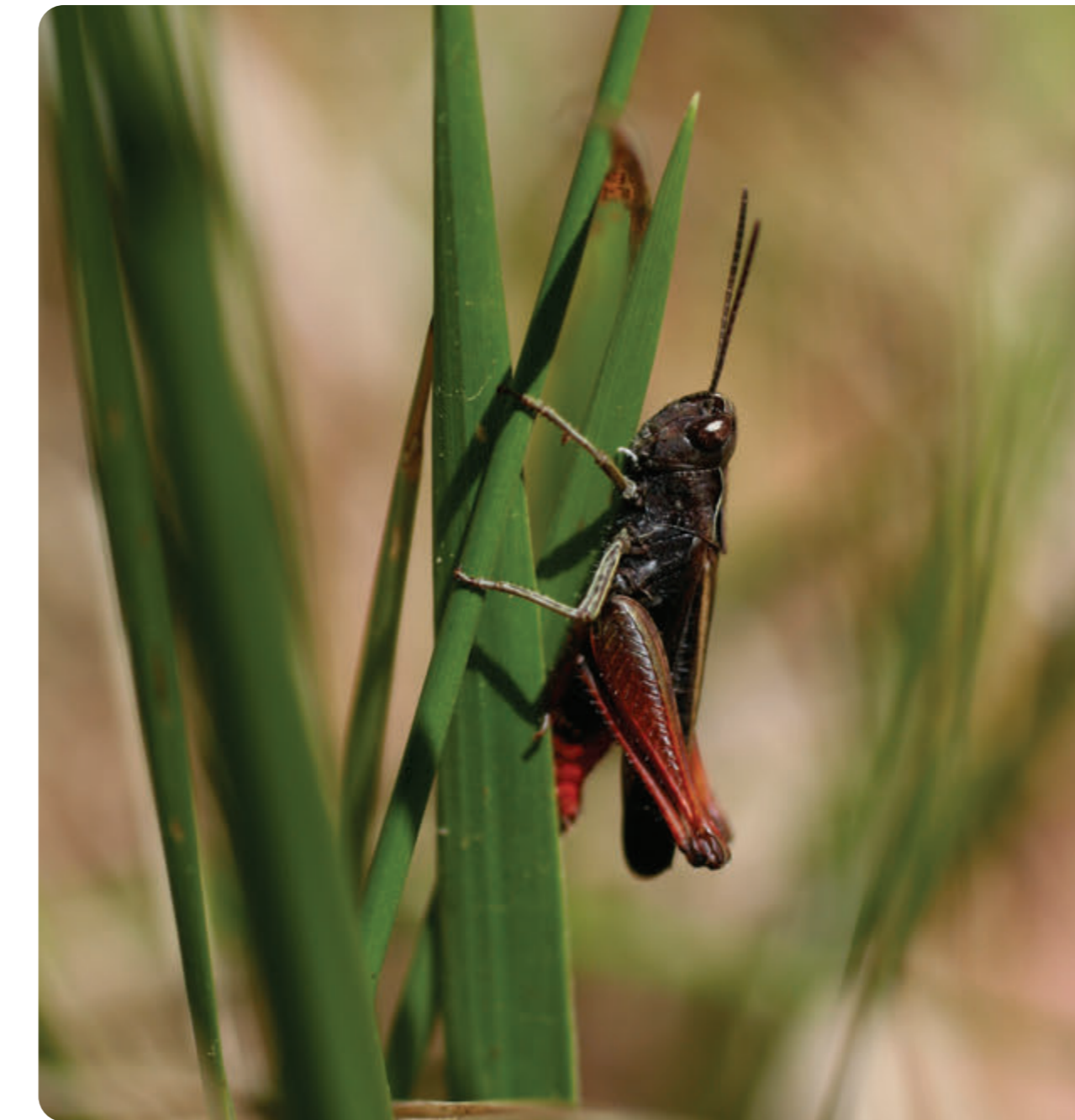
R. Monnehey Le Criquet noir-ébène

Un sentier balisé vous permet de traverser le larris, et de revenir par le chemin du bas. Un dépliant de présentation du site est téléchargeable sur le site internet du Conservatoire d'espaces naturels des Hauts-de-France. Un Arrêté Préfectoral de Protection de Biotope interdit notamment la circulation des engins à moteur, le camping et les feux.