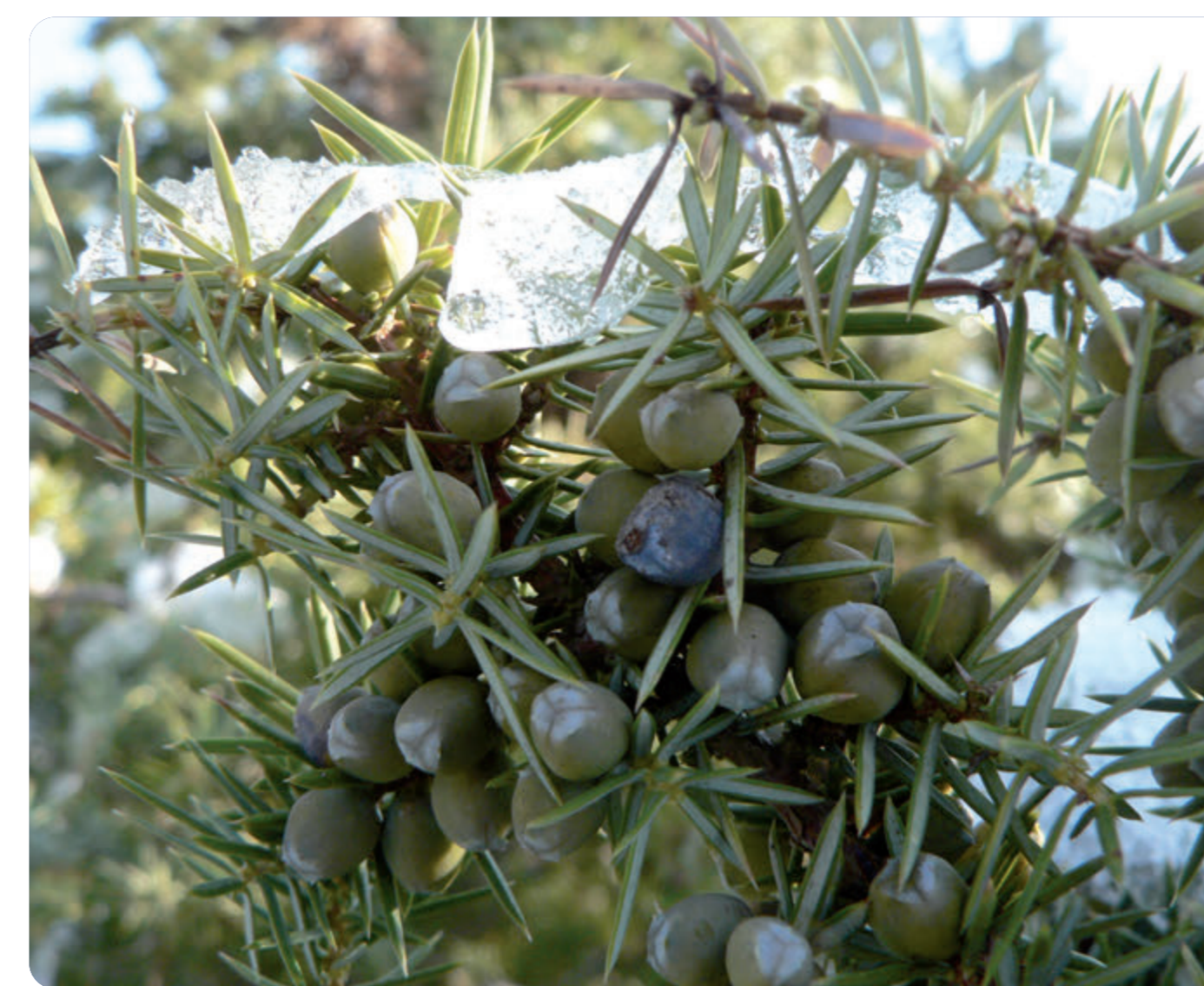
R. Monnehey Le Genévrier commun

En vous engageant sur le sentier, vous découvrez les genévriers sur une forte pente, et un sol de plus en plus aride, laissant apparaître des morceaux de craie.