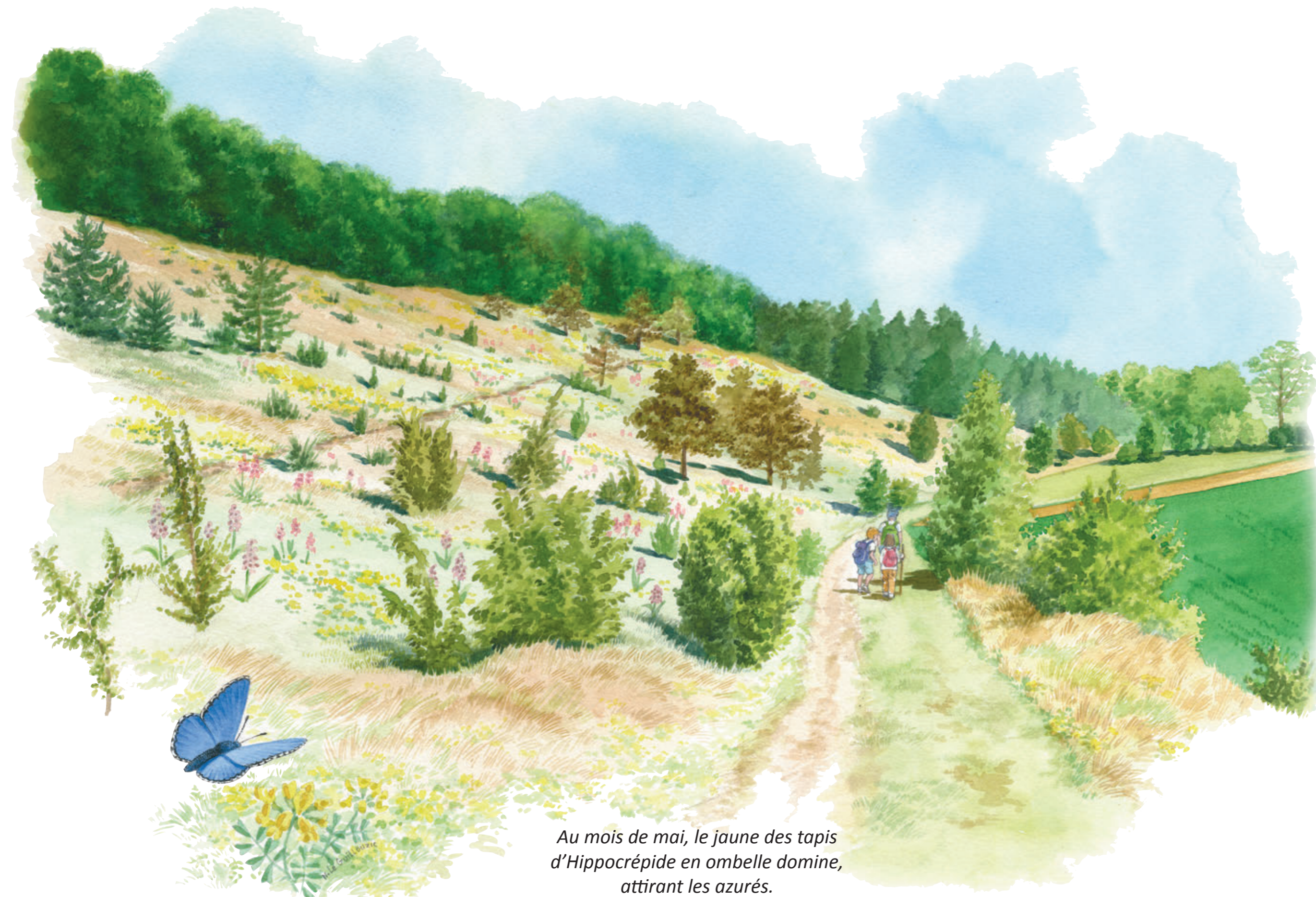
Au mois de mai, le jaune des tapis d'Hippocrévide en ombelle domine, attirant les azurés.

La vallée sèche «de Fignières à Boussicourt» se prolonge en direction de l'Avre et présente une pente douce où prairies et cultures se succèdent, entrecoupées de haies et de petits bois. Propriété de la Commune et préservé par le Conservatoire d'espaces naturels des Hauts-de-France, le versant plus pentu et non exploité, appelé localement «la Montagne», constitue l'un des plus remarquables larris du département de la Somme. Le terme picard «larris» désigne un coteau, une colline sèche parsemée de buissons.