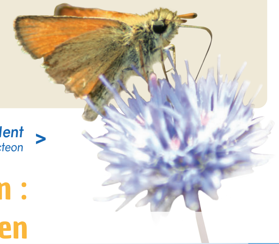
Hespérie du chiendent Thymelicus acteon

Die weidenden Schafe sind wichtige Verbündete bei der Erhaltung des Gebiets : ein Dutzend von Boulonnais-Schafe, eine rustikale Rasse aus Nordfrankreich, weiden und tragen somit zur Kurzhaltung der Grasflächen bei und begrenzen die Entwicklung von Sträuchern, die das Gebiet besiedeln.