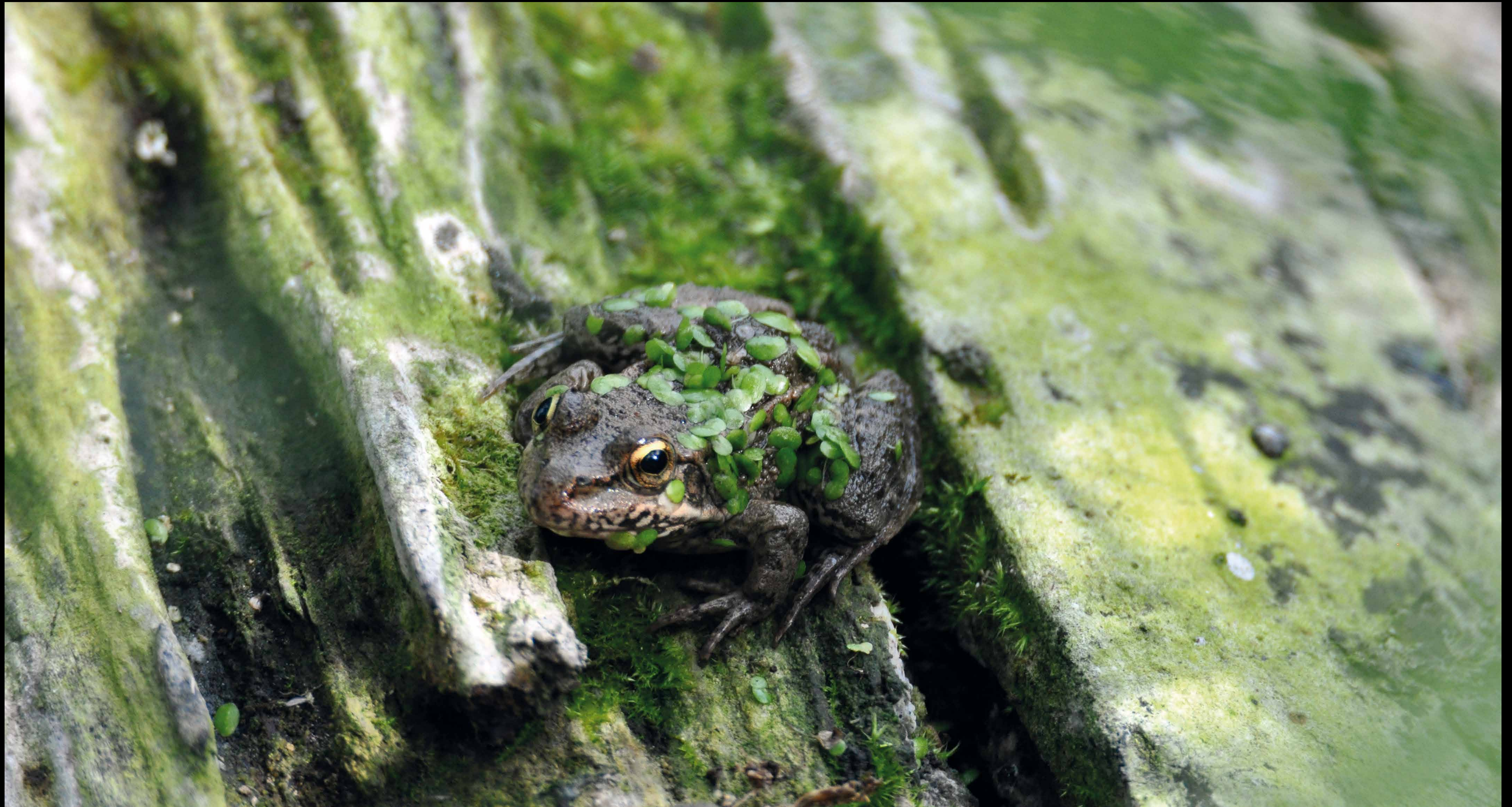
La Grenouille verte en mimétisme avec son environnement.