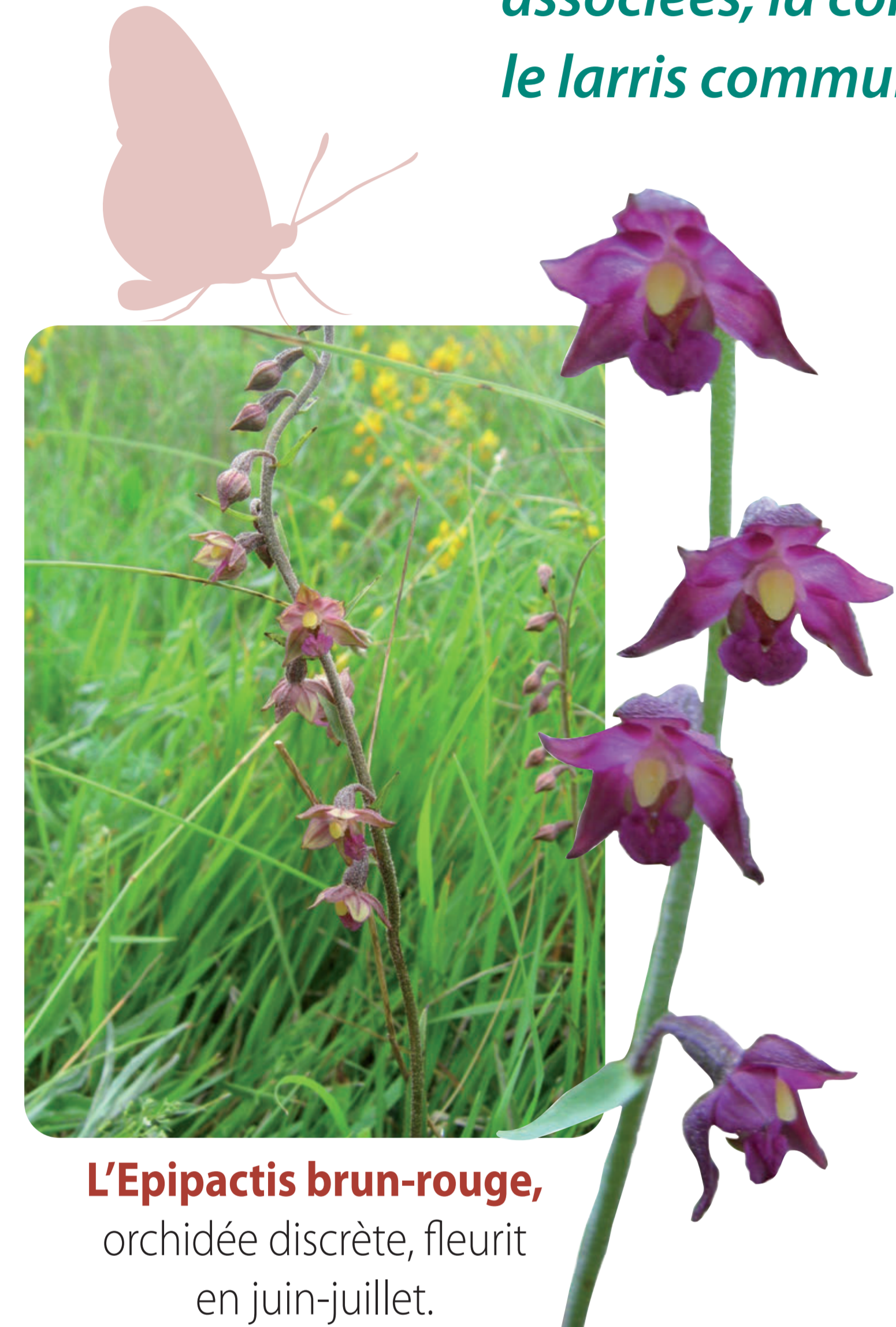
L'Epipactis brun-rouge , orchidée discrète, fleurit en juin-juillet.