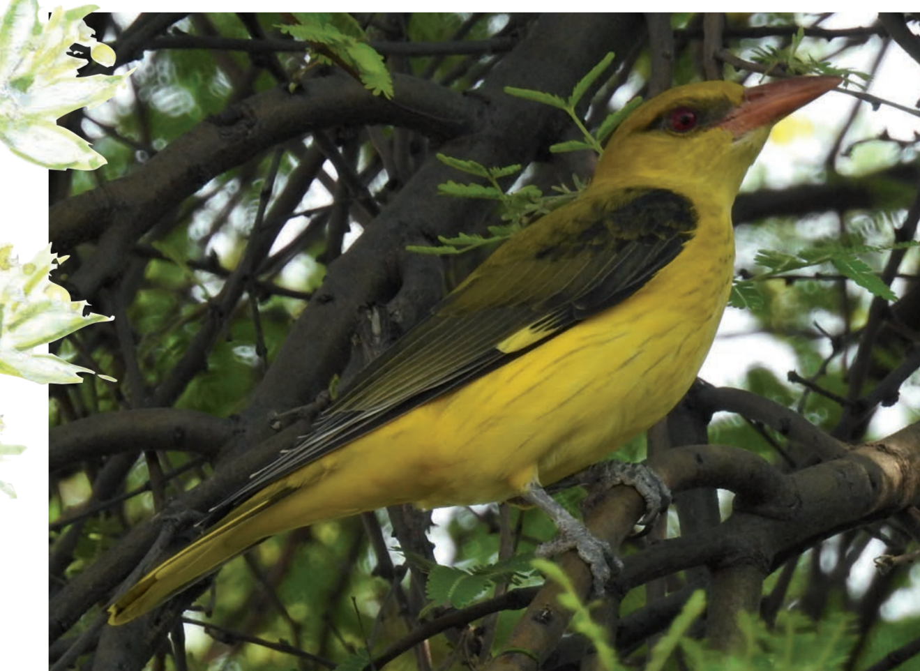
Le Lioriot d'Europe